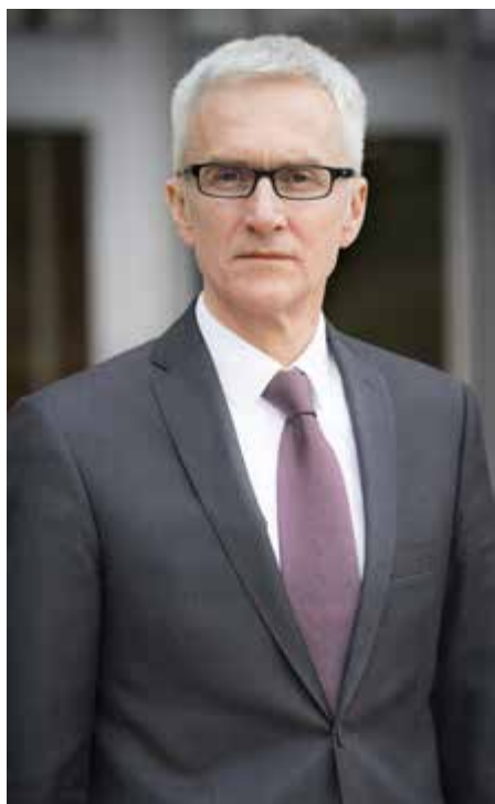
Rozmowa z Jürgenem Stockiem, sekretarzem generalnym INTERPOLU

Przystąpienie do organizacji międzynarodowej daje każdemu państwu działającemu w pojedynkę szansę na zwiększenie swoich możliwości. Jaka jest aktualna wartość dodana dla krajów stowarzyszonych w INTERPOLU?