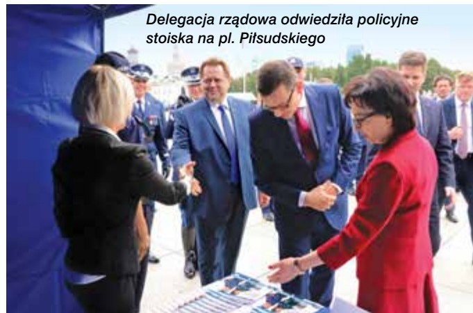
Delegacja rządowa odwiedziła policyjne stoiska na pl. Piłsudskiego

Ponad 123 lata trzeba było czekać, żeby na ulicach polskich miast odradzającej się Rzeczypospolitej zobaczyć polskiego policjanta. Ludzie się wtedy cieszyli. Dziś też, bo jak przypomniał pan prezydent, brawa dostała polska Policja podczas Światowych Dni Młodzieży, które odbyły się u nas w kraju. To był ogromny dowód szacunku i uznania dla Was i Waszej codziennej służby.