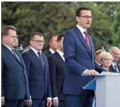
Głos zabrał premier Mateusz Morawiecki

do domu, wreszcie bezpieczny. Bo praca w Policji, służba, wiąże się z nieustannym ryzykiem, które świadomie podejmujecie po to, by dawać siebie innym.