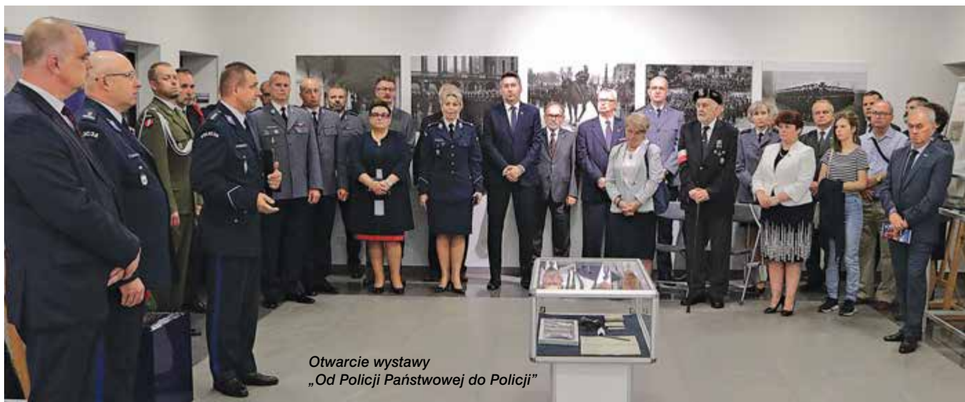
Otwarcie wystawy „Od Policji Państwowej do Policji”