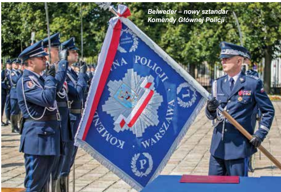
Belweder – nowy sztandar Komendy Głównej Policji

PAWEŁ OSTASZEWSKI zdj. autor i Jacek Herok (1)