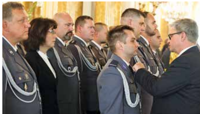
Wyróżnionych policjantów odznaczał na zamku także szef BBN Paweł Solocho

W tym czasie wzdłuż Międzymurza Piotra Biegańskiego na Starym Mieście mieszkańcy stolicy i turyści mogli odwiedzać policyjne stoiska profilaktyczne, które wystawiły wszystkie garnizony i szkoły Policji (więcej o pikniku policyjnym piszemy na s. 18).