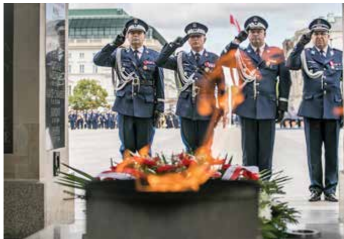
Kierownictwo polskiej Policji złożyło wieniec na płycie Grobu Nieznanego Żołnierza