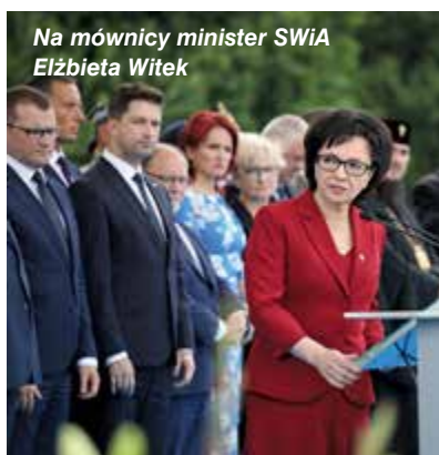
Na mównicy minister SWiA Elżbieta Witek

– Wprawdzie Święto Policji obchodzimy co roku, ale tylko raz na sto lat trafia się takie święto jak dziś – powiedziała pani minister. – Wszyscy jesteśmy uczestnikami tej historycznej chwili. Patrę przed siebie i widzę pomnik marszałka Józefa Piłsudskiego. Myślę, że gdyby tu był, byłby z Was bardzo dumny, tak jak i ja jestem dumna, jak dumne jest z Was państwo polskie.