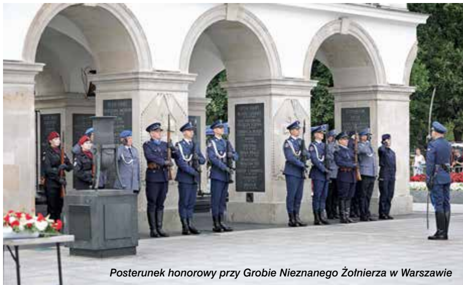
Posterunek honorowy przy Grobie Nieznanego Żołnierza w Warszawie

– Melduję, że w drugie stulecie polska Policja wkracza ze stuprocentowym zaangażo-