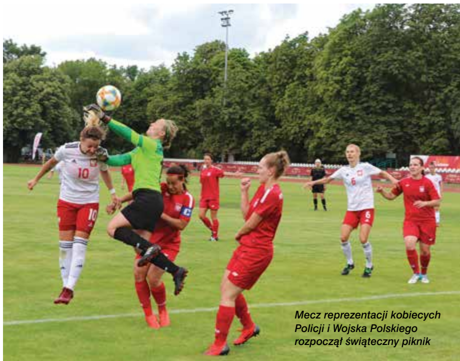
Mecz reprezentacji kobiecych Policji i Wojska Polskiego rozpoczął świąteczny piknik

Padło przekazała pieniądze zebrane wśród nowojorskich policjantów.