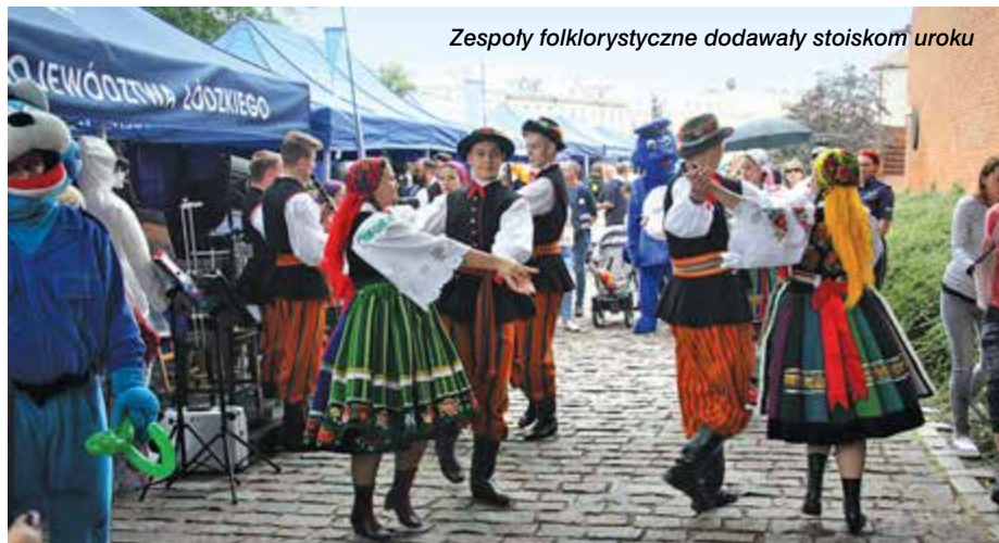
Zespoły folklorystyczne dodawały stoiskom uroku