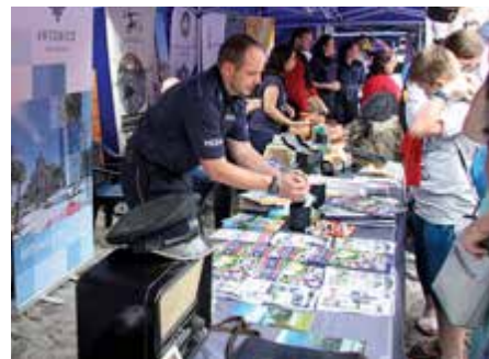
Odwiedzający znajdowali na stoiskach nie tylko typowo policyjne rzeczy, ale i np. przewodniki po regionach Polski