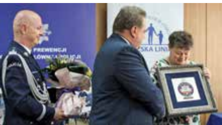
Spotkanie w KGP z laureatami konkursu „Policjant, który mi pomógł”