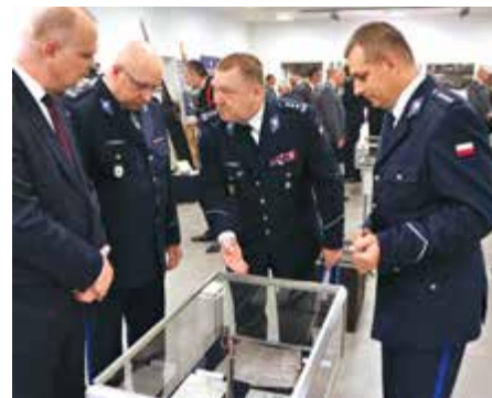
Wystawa w Biurze Edukacji Historycznej – Muzeum Policji KGP

Centralne obchody rozpoczęły się w poniedziałek 22 lipca, gdy w siedzibie Biura Edukacji Historycznej – Muzeum Policji KGP uroczysto otwarto wystawę „Od Policji Państwowej do Policji” (szerzej piszemy o niej na s. 22).