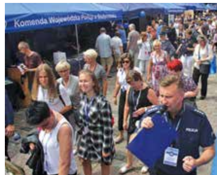
Międzymurze tłumnie odwiedzali mieszkańcy i turyści

dem z województwa warmińsko-mazurskiego. Każdy, kto odwiedził stoiska policyjne w Święto Policji, odchodził z niezapomnianymi wrażeniami i bogatszy w praktyczną wiedzę.