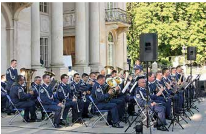
Koncert orkiestr policyjnych w Łazienkach Królewskich