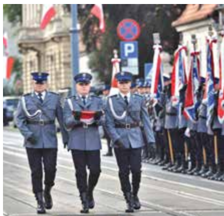
Policyjna 1939 r.” w Łodzi.