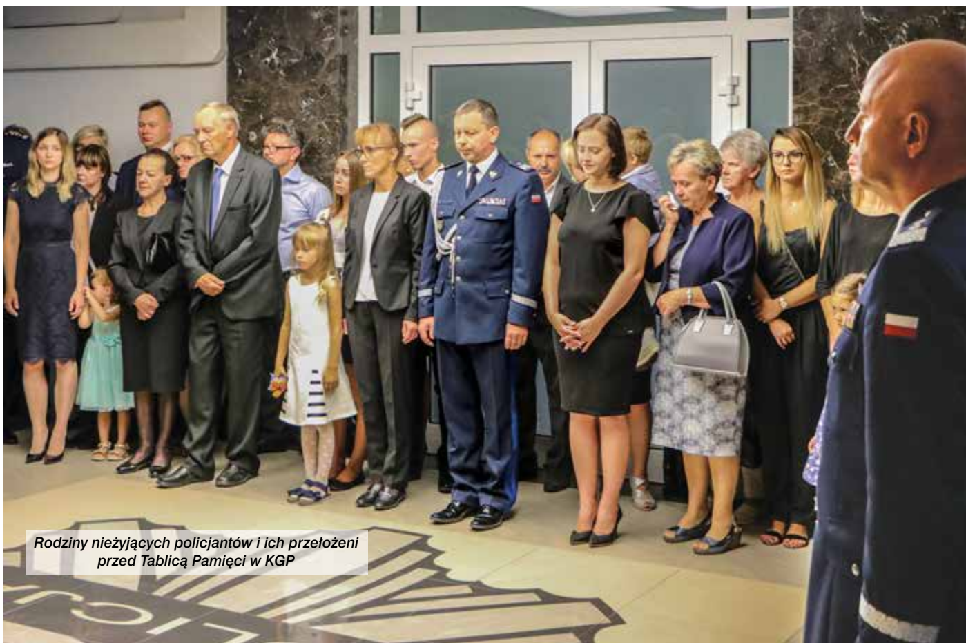
Rodziny niezujących policjantów i ich przełożeni przed Tablicą Pamięci w KGP