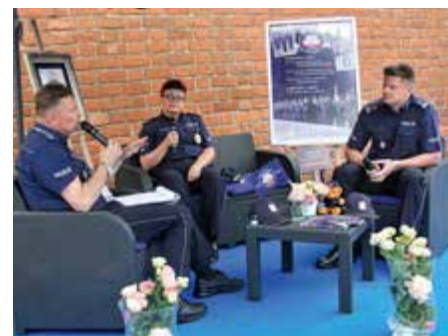
Panele tematyczne skupiały uwagę wielu odwiedzających piknik