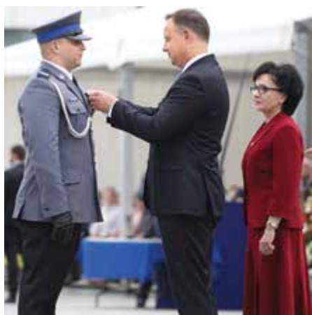
Jeden z policjantów odznaczonych podczas uroczystości na pl. Piłsudskiego

waniem i deklaruję, że zrobimy wszystko, by Polska nadal była niezwykle bezpiecznym krajem, a wszyscy, którzy tutaj mieszkają i tutaj przyjeżdżają, mogli czuć się bardzo bezpiecznie, bo my, szanowni państwo, jesteśmy Waszą Policją.