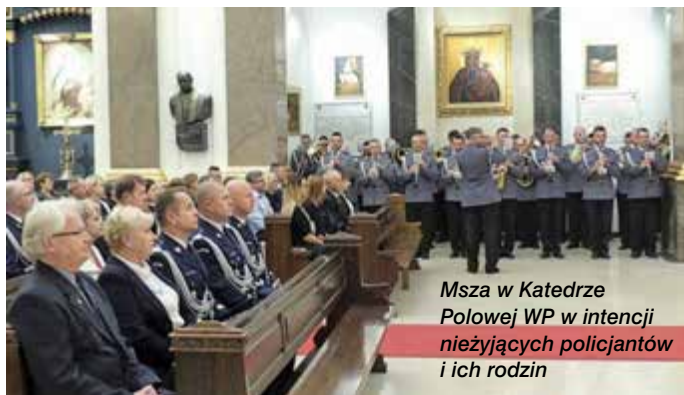
Msza w Katedrze Polowej WP w intencji niezujących policjantów i ich rodzin