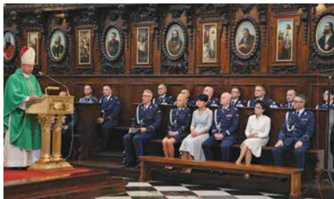
Msza św. w Bazylice Świętego Krzyża w Warszawie