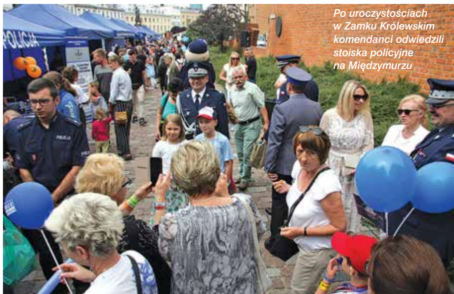
Po uroczystościach w Zamku Królewskim komendanci odwiedzili stoiska policyjne na Międzymurzu