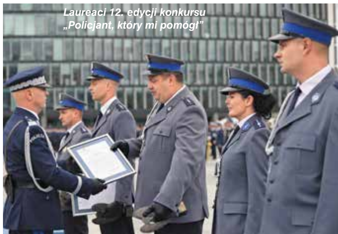
Laureaci 12. edycji konkursu „Policjant, który mi pomógł”