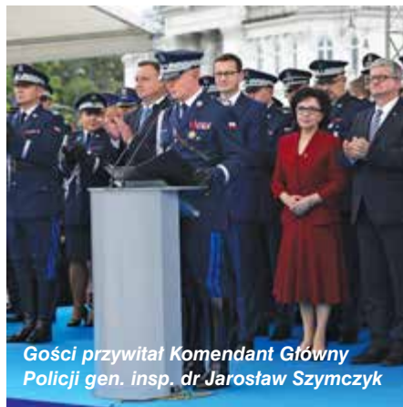
Gości przywitał Komendant Główny Policji gen. insp. dr Jarosław Szymczyk

Przybyłych gości przywitał Komendant Główny Policji gen. insp. dr Jarosław Szymczyk. W swoim wystąpieniu przypomniał his-