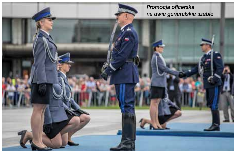
Promocja oficerska na dwie generalskie szable

– Chylę głęboko czoła przed tymi, którzy oddali życie w służbie – powiedział Prezydent RP Andrzej Duda. – Chylę głęboko czoła przed wszystkimi, którzy w służbie nie wahali się odnieść ran po to, by pomagać i ratować drugiego człowieka, po to, by ratować mienie. Po to, by starać się, aby Polska była państwem bezpiecznym i sprawiedliwym. Jestem Wam za to ogromnie wdzięczny. Wam i Waszym Najbliższym. To jest tak, że służy nie tylko funkcjonariusz, służy nie tylko policjant, służy także jego rodzina, która czeka, kiedy wróci on po służbie