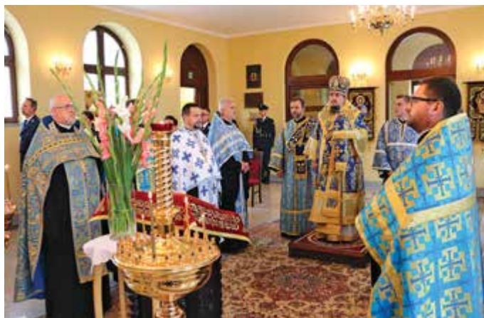
Prawosławne nabożeństwo dziękczynne