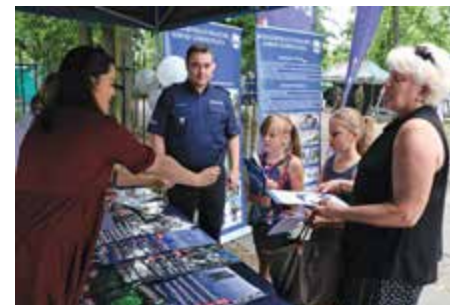
Na stoisku promocyjnym Biura Komunikacji Społecznej KGP można było otrzymać m.in. najnowszy numer miesięcznika „Policja 997”

W chwilach przerwy od sportowych emocji grała Orkiestra Reprezentacyjna Policji oraz występowały cheerleaderki Bell Arto. Goście zwiedzali stoiska przygotowane m.in. przez Biuro Ruchu Drogowego KGP, Biuro Prewencji KGP, Biuro Komunikacji Społecznej KGP, Biuro Edukacji Historycznej – Muzeum Po-