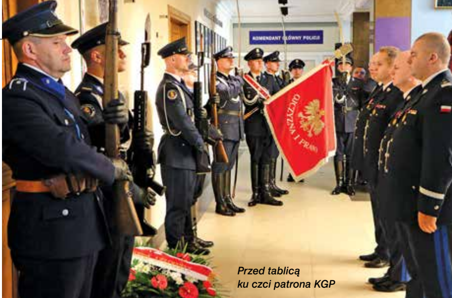
Przed tablicą ku czci patrona KGP

Zwieńczeniem obchodów setnego jubileuszu powołania Policji Państwowej w KGP była odbywająca się tego samego dnia uroczystość nadania jej nowego sztandaru. Ceremonia odbyła się na dziedzińcu Belwederu i połączona była z wręczeniem odznaczeń osobom zasłużonym oraz funkcjonariuszom i pracownikom KGP. Obecni byli szef Gabinetu Politycznego Prezesa Rady Ministrów Marek Suski, minister SWiA Elżbieta Witek, sekre-