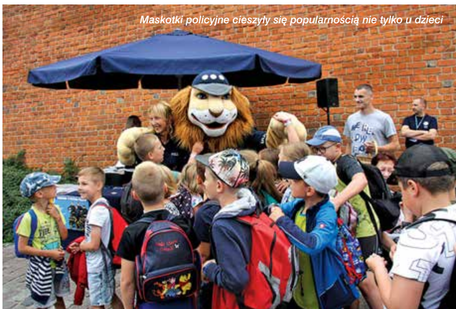
Maskotki policyjne cieszyły się popularnością nie tylko u dzieci