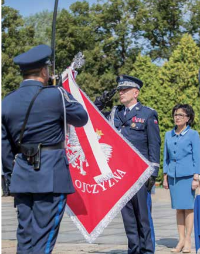
Na dziedzińcu Belwederu KGP otrzymała nowy sztandar