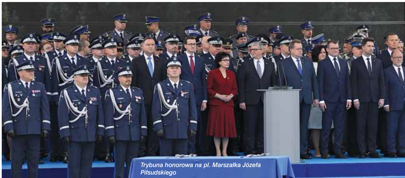
Trybuna honorowa na pl. Marszałka Józefa Piłsudskiego