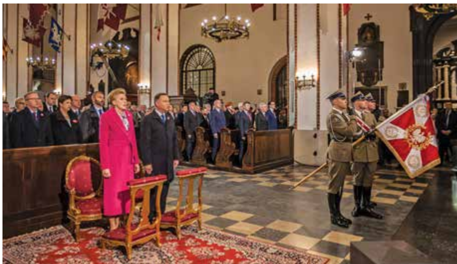
Uroczystości poprzedziła msza św. z udziałem pary prezydenckiej

W tym roku po raz pierwszy wraz z żołnierzami defilowali funkcjonariusze Policji oraz Straży Granicznej, Państwowej Straży Pożarnej, Służby Ochrony Państwa, Straży Marszałkowskiej, Służby Ochrony Kolei, Lasów Państwowych, a także Służby Więziennej i Krajowej Administracji Skarbowej. Wcześniej, w ramach obchodów Narodowego Święta 3 Maja, odbyła się uroczysta msza oraz uroczystości na pl. Zamkowym w Warszawie.