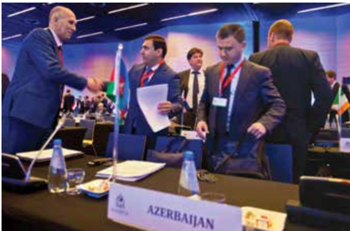
Konferencje regionalne to doskonała okazja do nawiązania osobistych kontaktów

zwalczania przestępczości zorganizowanej w ujęciu europejskim, prezentując doskonale rozeznanie w najnowszych metodach działania grup przestępczych. W trakcie popołudniowych sesji w podgrupach omówiono również tematy związane z implementacją zielonych i niebieskich not INTERPOLU, przedstawiono, z jakimi problemami natury prawnej w Europie i na świecie spotykają się poszukiwania międzynarodowe.