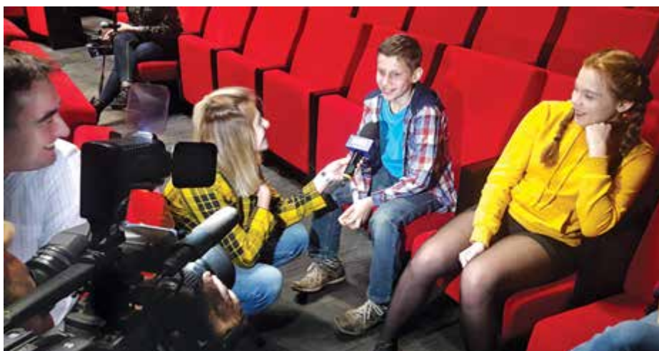
Młodzi aktorzy podczas wywiadu dla TVP Białystok

Początki nie były łatwe. Nie było sceny, aktorów. Nikt oprócz reżyser się na teatrze nie znał.