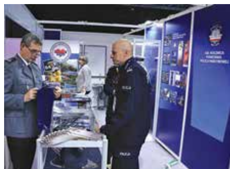
Biuro Historii i Tradycji KGP przygotowało zwiedzającym ciekawe materiały o dziejach policji

Ale nowości wchodzących na rynek i do wyposażenia Policji było więcej. Firmy motoryzacyjne, m.in. Volkswagen, Mercedes, BMW czy KIA prezentowały swoje pojazdy napędzane energią elektryczną. Wystawiany był także pojazd patrolowo-wypadowy Praetorian, o którego testach pisaliśmy w „Policja 997” nr 4 (169), a teraz prezentowano go po dokonanych licznych zmianach. Bardzo dużym zainteresowaniem cieszył się najnowszy Taser 7, czyli elektryczne urządzenie obездwładniające. Jego sondy lecą szybciej, mają spłaszczoną trajektorię lotu, co gwarantuje lepsze połączenie z celem. Urządze-