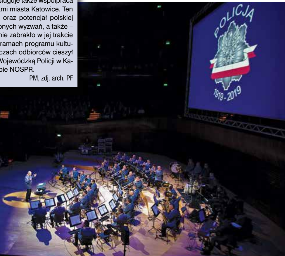
Koncert z okazji 100. rocznicy powołania Policji Państwowej w sali NOSPR