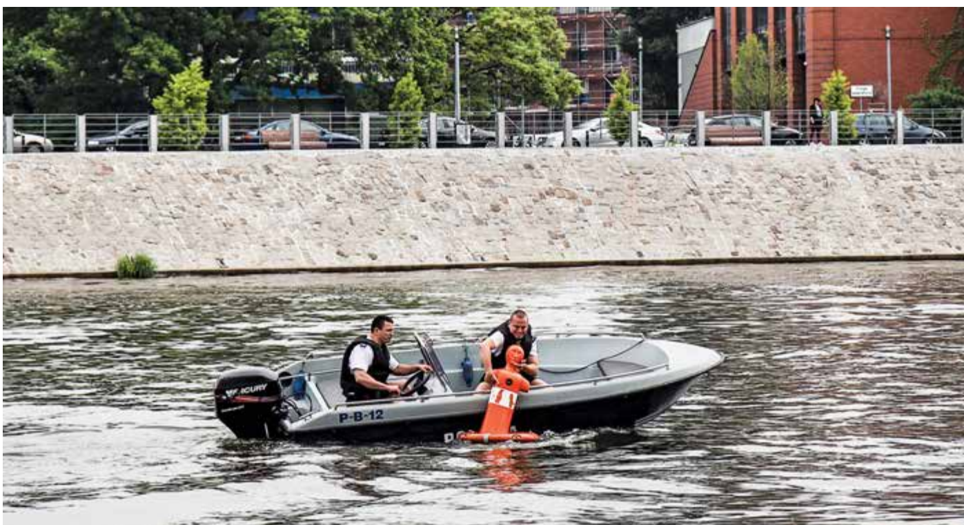
Podjęcie „topielca” na Odrze

PAWEŁ OSTASZEWSKI