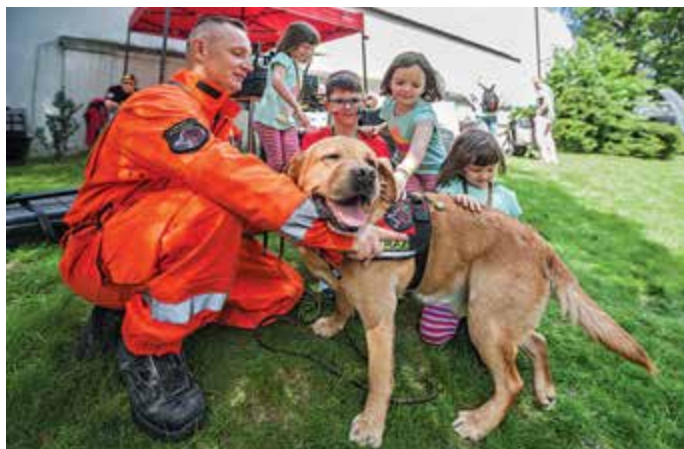
Niemal wszystkie służby prezentowały swoje czworonogi, które z radością przyjmowały pieszczoty dziecięcych rączek

Otwarte drzwi radiowozu zapraszały do wejścia do środka i robienia sobie pamiątkowych zdjęć. Na ciężki motocykl policyjny wsiadali przede wszystkim chłopcy, ale już w kolejce do miasteczka ruchu