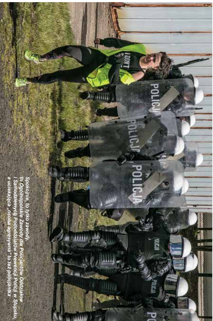
Spokojnie, to tylko zawody, III Ogólnopolskie Zawody dla Policjantów Oddziałów i Samodzielnych Pododdziałów Prewencji Policji w Słupsku, a uciekająca „osoba agresywna” to też policjantka