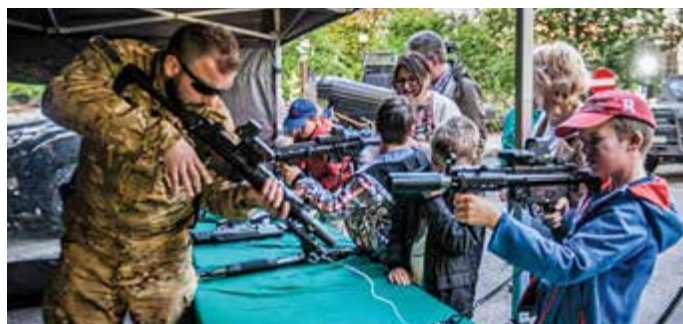
Funkcjonariusze CPKP „BOA” prezentowali m.in. broń, którą na co dzień się posługują