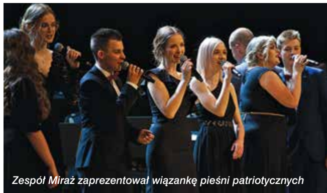
Zespół Miraż zaprezentował wiązanekę pieśni patriotycznych