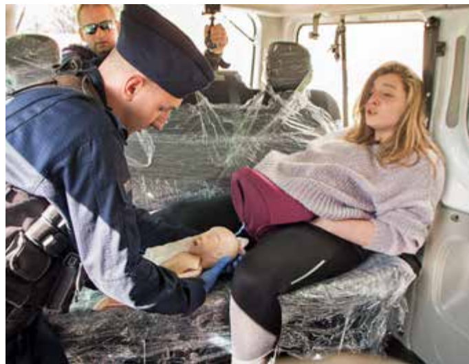
Odbieranie porodu w warunkach publicznych