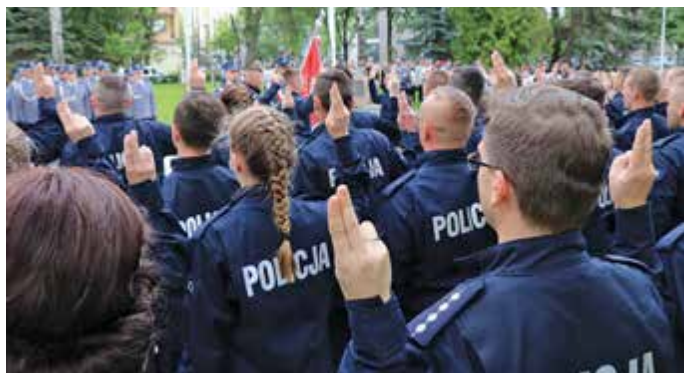
Przysięgę złożyło 48 funkcjonariuszy Policji