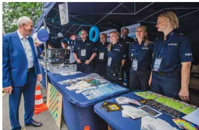
Minister Krzysztof Tchórzewski ogląda stoisko policyjne

drogowego i rowerowego toru przeszkód było również sporo dziewczyn. Chorągiewki i pluszowe, policyjne misie ze stoiska Gabinetu Komendanta Głównego Policji brali za to solidarnie wszyscy. Nie zabrakło też przygotowanych przez Biuro Komunikacji Społecznej KGP kolorowanek dla najmłodszych oraz krzyżówki z nagrodami. Dla najmłodszych nagrodą były zarówno maskotki, jak i ostatnie wydanie policyjnego komiksu „Sekret kamienicy”. Starsi z kolei chętnie brali