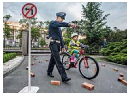
Rowerowy tor przeszkód na dziedzińcu KGP