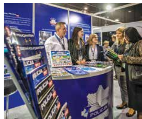
Na stoisku Biura Komunikacji Społecznej KGP zwiedzający targi mogli otrzymać m.in. ostatni numer miesięcznika „Policja 997”

nie to posiada zielony celownik laserowy, który jest lepiej widoczny w ciągu dnia. Dla antyterrorystów zaprezentowano izraelską partię urządzeń XAVER 400 przedsiębiorstwa Camero służących do obrazowania położenia obiektów stacjonarnych i ruchomych z zewnątrz budynku lub pomieszczenia. Dzięki niemu można wykrywać obiekty z dystansu do 20 m przez ściany ceglane, cementowe, betonowe, z betonu zbrojonego czy płyt gipsowo-kartonowych. Urządzenie ma opcję śledzenia ruchu obiektów i zapamiętuje ich wcześniejsze położenie. Policijni ratownicy medyczni z uznaniem patrzyli na Easy Pulse firmy Schiller, najnowsze automatyczne urządzenie do uciskania klatki piersiowej, które może być niezastąpione np. w przypadku