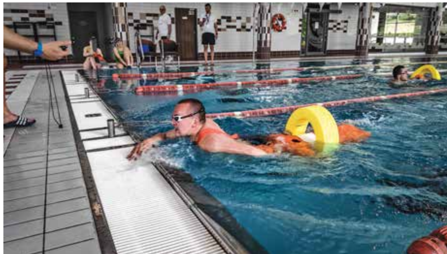
Konkurencja na pływalni

► pokaz skuteczności dolnośląskich antyterrorystów. Wystąpiła także Orkiestra KWP we Wrocławiu.