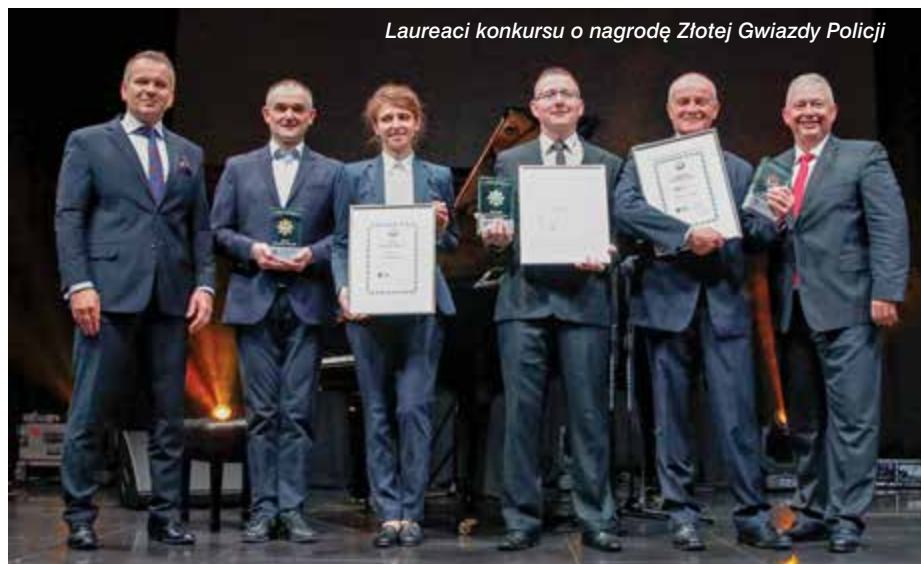
Laureaci konkursu o nagrodę Złotej Gwiazdy Policji