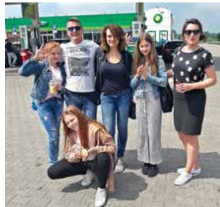
8 godzin w trasie, mimo zmęczenia dobry humor nie opuszczał ekipy Amatorskiej Sceny Policyjnej

ANNA KRAWCZYŃSKA