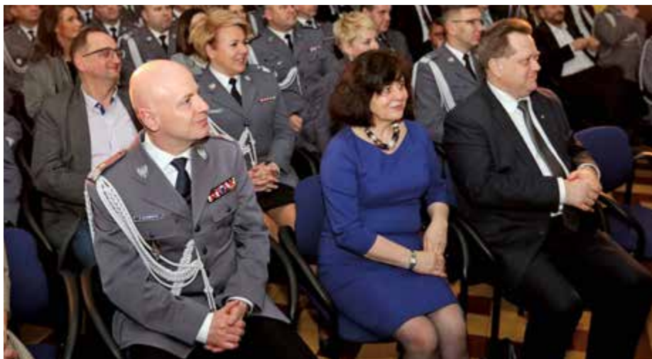
Na premierze, która odbyła się 26 stycznia 2018 r. w Muzeum Żołnierzy Wyklętych i Więźniów Politycznych PRL, gośćmi honorowymi byli sekretarz stanu w MSWiA Jarosław Zieliński z małżonką, gospodarzem zaś komendant główny Policji

w Warszawie. Przedsięwzięcie, podobnie jak spektakl przygotowany przez Amatorską Scenę Policyjną „Na Posterunku”, jest integralną częścią „Koncepcji zintegrowanych działań polskiej Policji na poziomie centralnym, w ramach przygotowań i obchodów