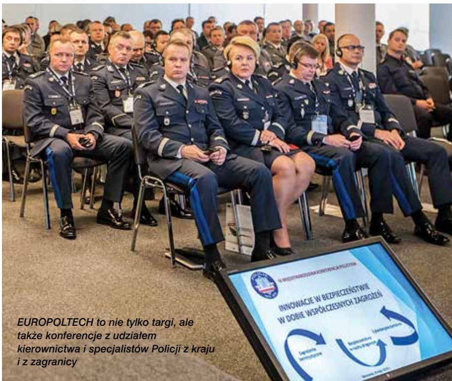
EUROPOLTECH to nie tylko targi, ale także konferencje z udziałem kierownictwa i specjalistów Policji z kraju i z zagranicy

W panelu dotyczącym zagrożeń terrorystycznych wzięli udział samorządowcy oraz przedstawiciele policji z Francji, Hiszpanii, Niemiec i Belgii. Z kolei do dyskusji na temat bezpieczeństwa w ruchu drogowym został zaproszony zastępca szefa norweskiej policji. ▶