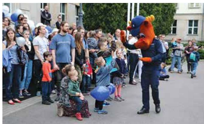
Dzieci oczarował Łoś, maskotka KPP w Wyszkowie