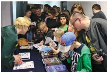
Stoisko Biura Komunikacji Społecznej KGP