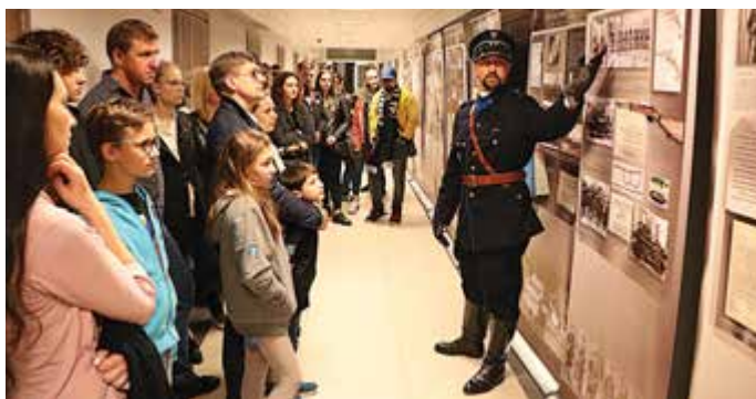
BHiTP przygotowało wystawę „Na Posterunku”

PAWEŁ OSTASZEWSKI