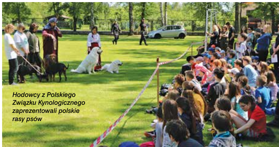
Hodowcy z Polskiego Związku Kynologicznego zaprezentowali polskie rasy psów

W przeddzień Dnia Dziecka do Zakładu Kynologii Policyjnej w Sułkowicach CSP w Legionowie przybyły tłumy małych i większych gości. Raz w roku – podczas dnia otwartego – można zwiedzić psią jednostkę, poznać tajniki tresury i skorzystać z atrakcji przygotowanych także przez inne służby mundurowe. Imprezę patronatem medialnym objął Miesięcznik „Policja 997”.