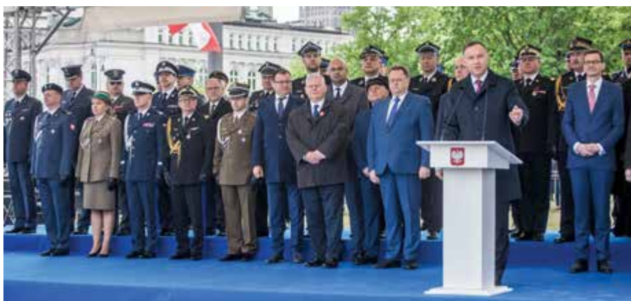
Przemówienie Prezydenta RP Andrzeja Dudy

W wielkiej defiladzie zorganizowanej w warszawskiej Wisłostradzie maszerowało przeszło 2000 żołnierzy Wojska Polskiego i wojsk sojuszniczych, pododdziały formacji proobronnych, klasy mundurowe oraz poczty sztandarowe krajowe i zagraniczne, m.in.