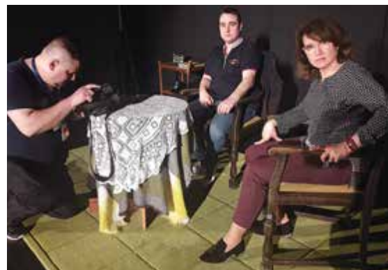
Próba, tym razem do nagrania materiałów wideo

Chociaż wyjazdy ze spektaklem „Służba” się skończyły, Amatorska Scena Policyjna bę-