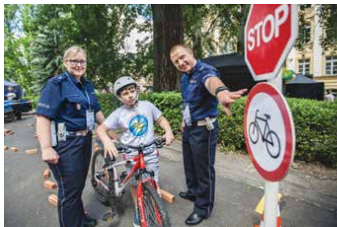
Miasteczko ruchu drogowego cieszyło się ogromną popularnością

drogowego i rowerowego toru przeszkód było również sporo dziewczyn. Chorągiewki i pluszowe, policyjne misie ze stoiska Gabinetu Komendanta Głównego Policji brali za to solidarnie wszyscy. Nie zabrakło też przygotowanych przez Biuro Komunikacji Społecznej KGP kolorowanek dla najmłodszych oraz krzyżówki z nagrodami. Dla najmłodszych nagrodą były zarówno maskotki, jak i ostatnie wydanie policyjnego komiksu „Sekret kamienicy”. Starsi z kolei chętnie brali