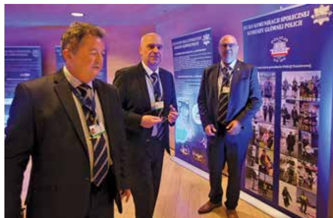
W holu MCK stanęła wystawa dwujęzycznych banerów BKS i BHI TP KGP prezentujących służby prasowe i historię polskiej Policji

Szczególną częścią konferencji był zorganizowany 30 maja w sali koncertowej Narodowej Orkiestry Symfonicznej Polskiego Radia w Katowicach koncert z okazji 100. rocznicy powstania Policji