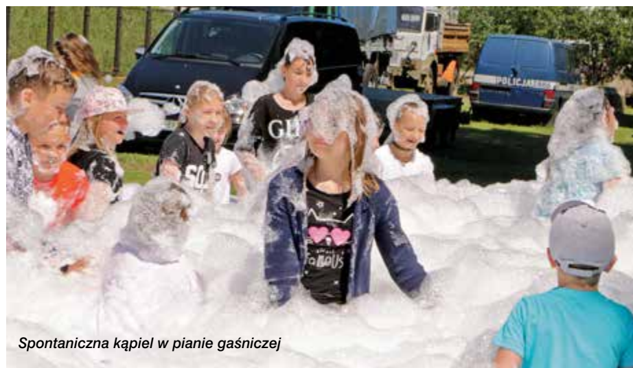
Spontaniczna kąpiel w pianie gaśniczej