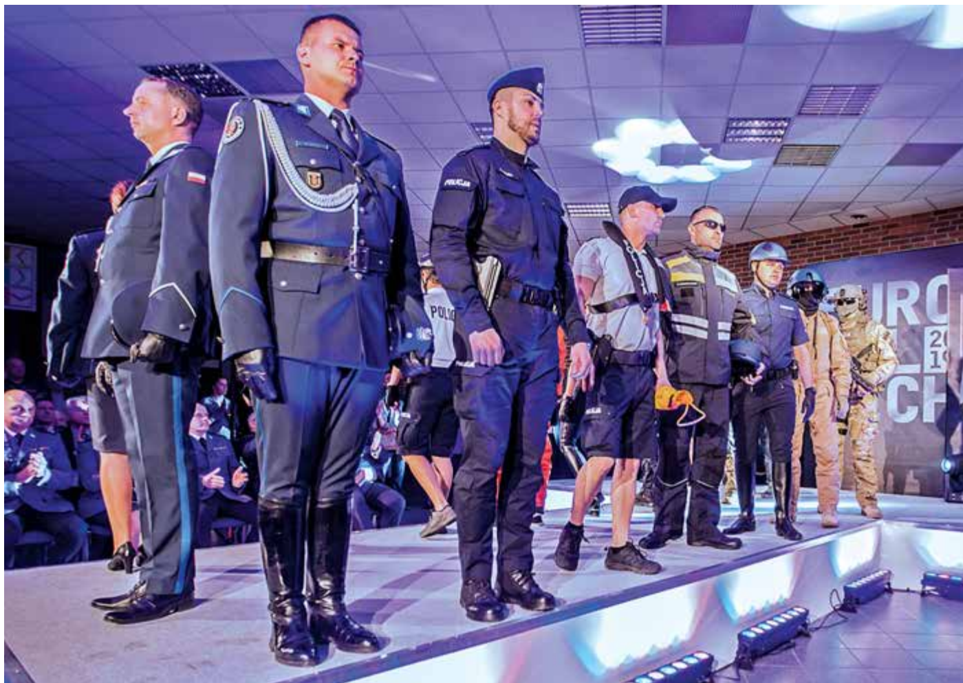
Pokaz umundurowania zorganizowało Biuro Logistyki KGP przy współudziale Biura Komunikacji Społecznej KGP