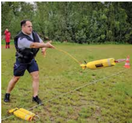
Rzutki w akcji