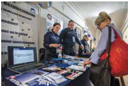
Stoisko Biura Prewencji KGP

Podobna uroczystość odbyła się chwilę później wewnątrz gmachu przed Tablicą Pamięci, na której umieszczone są inskrypcje epitafijne poległych na służbie funkcjonariuszy.