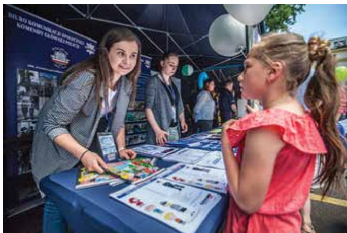
Najmłodszy chętnie rozwiązywał krzyżówkę policyjną, przygotowaną przez BKS KGP

Tak było również w przypadku policyjnych namiotów, gdzie chętni mogli znaleźć zarówno coś dla najmłodszych, jak i zupełnie dorosłych. Na głównej scenie, ustawionej w samym środku ogrodu, odbył się też