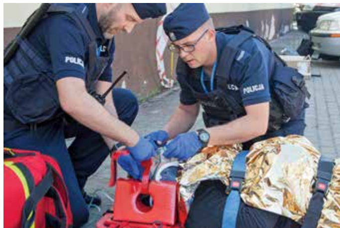
Pomoc poszkodowanemu po upadku z wysokości

– Trudno osiągnąć górny limit 60 punktów – mówili po wyjściu z sali policyjni ratownicy. Najwyższą notę 53 punktów w teście zdobyła drużyna z Komendy Wojewódzkiej Policji w Gdańsku. Najszybsi we wszystkich konkurencjach byli z kolei policjanci z Komendy Wojewódzkiej Policji w Bydgoszczy, osiągając czas 17:43.