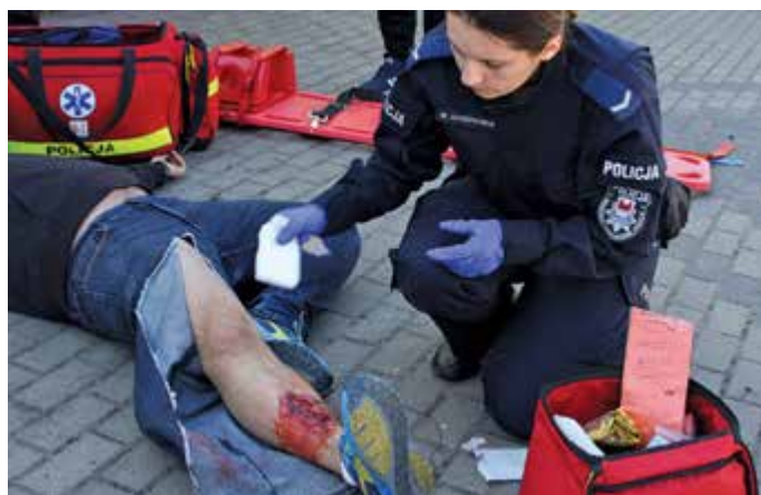
Zabezpieczenie złamań i ran u poszkodowanego