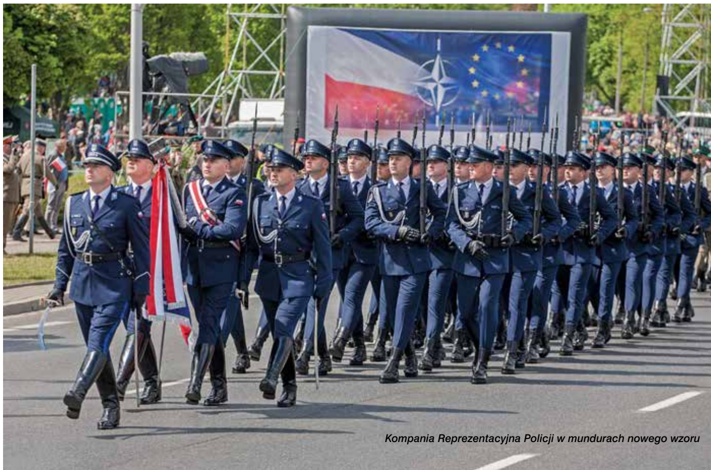
Kompania Reprezentacyjna Policji w mundurach nowego wzoru