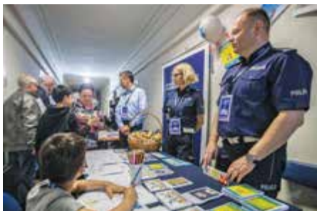
Stoisko Biura Ruchu Drogowego KGP