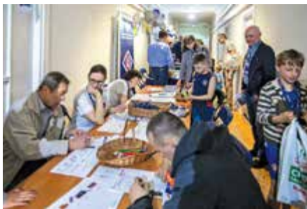
Stoisko Gabinetu Komendanta Głównego Policji