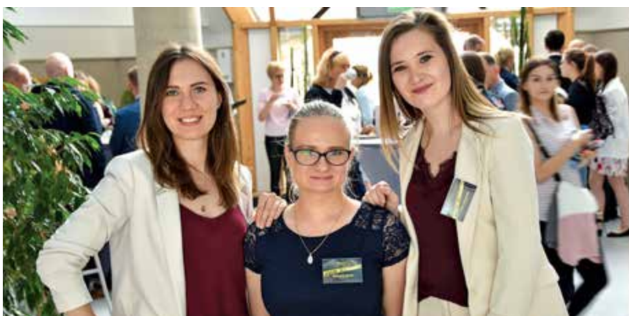
Uczestniczki IV Konferencji Młodych Chemików Sądowych w Białymstoku