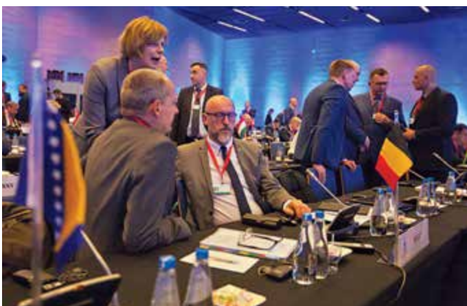
Dyskusje toczyły się głównie w panelach

zwalczania przestępczości zorganizowanej w ujęciu europejskim, prezentując doskonale rozeznanie w najnowszych metodach działania grup przestępczych. W trakcie popołudniowych sesji w podgrupach omówiono również tematy związane z implementacją zielonych i niebieskich not INTERPOLU, przedstawiono, z jakimi problemami natury prawnej w Europie i na świecie spotykają się poszukiwania międzynarodowe.