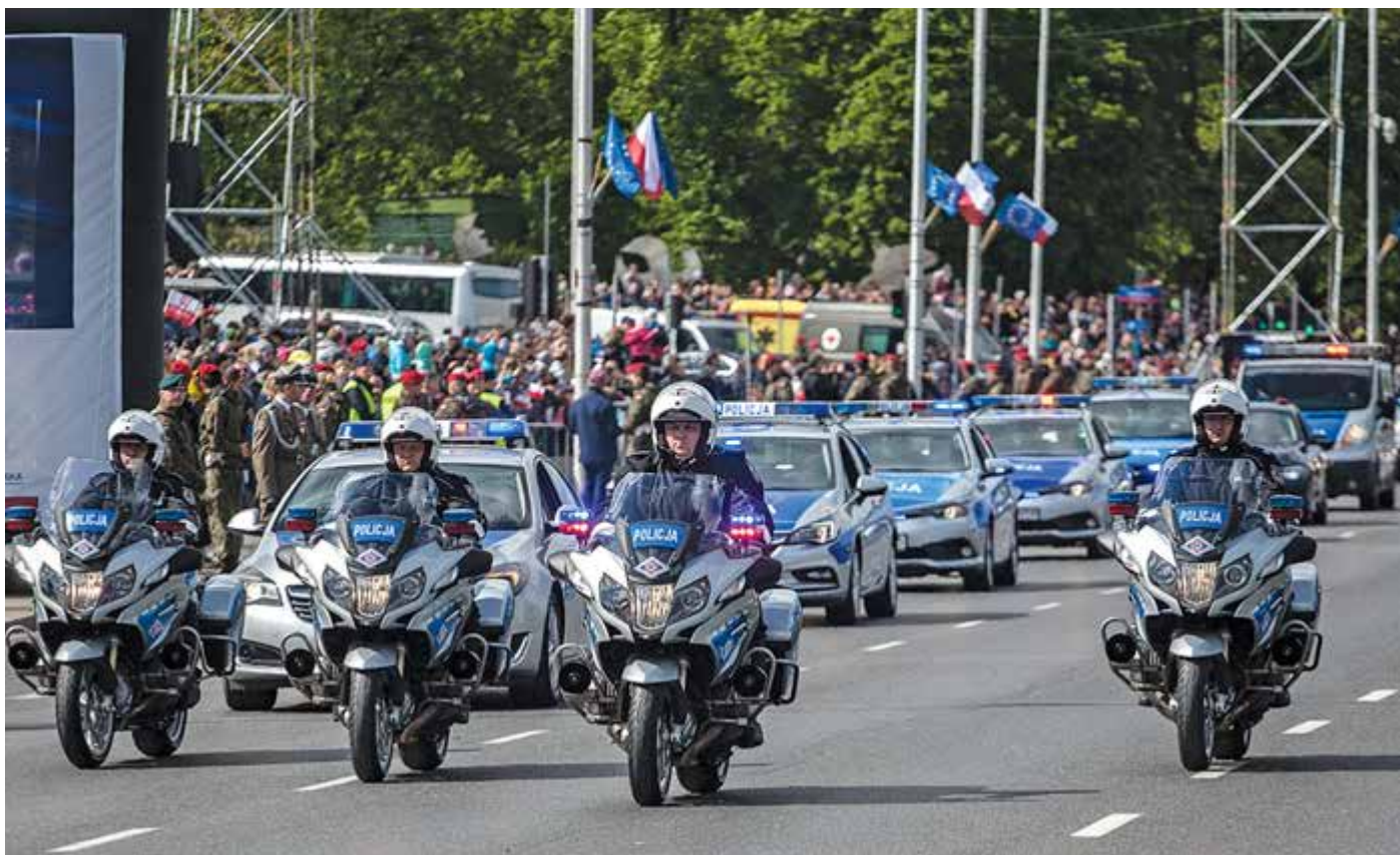
W defiladzie udział wzięty niemal wszystkie typy sprzętu transportowego Policji. Na zdjęciu: Motocyklowa Asysta Honorowa