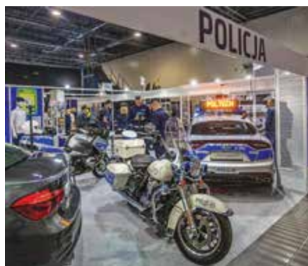
Sensacją ekspozycji Biura Logistyki Policji KGP był jedyny w polskiej Policji motocykl Harley Davidson, wykorzystywany do służby przez Komendę Miejską Policji w Rzeszowie

nie to posiada zielony celownik laserowy, który jest lepiej widoczny w ciągu dnia. Dla antyterrorystów zaprezentowano izraelską partię urządzeń XAVER 400 przedsiębiorstwa Camero służących do obrazowania położenia obiektów stacjonarnych i ruchomych z zewnątrz budynku lub pomieszczenia. Dzięki niemu można wykrywać obiekty z dystansu do 20 m przez ściany ceglane, cementowe, betonowe, z betonu zbrojonego czy płyt gipsowo-kartonowych. Urządzenie ma opcję śledzenia ruchu obiektów i zapamiętuje ich wcześniejsze położenie. Policijni ratownicy medyczni z uznaniem patrzyli na Easy Pulse firmy Schiller, najnowsze automatyczne urządzenie do uciskania klatki piersiowej, które może być niezastąpione np. w przypadku