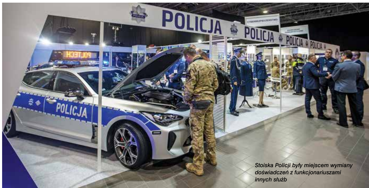
Stoiska Policji były miejscem wymiany doświadczeń z funkcjonariuszami innych służb

Wnioski, jakie wysunęły się podczas tej wymiany doświadczeń, to potrzeba systemowych rozwiązań, ciągłe monitorowanie bieżących problemów, metod i procedur oraz współpraca Policji z samorządem.