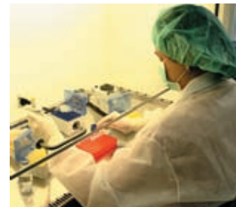
Polscy eksperci zajmujący się DNA należą do czołówki europejskiej w tej dziedzinie

Poza CLK KGP mamy jeszcze 11 laboratoriów wojewódzkich, w których prowadzi się badania DNA. Obowiązuje rejonizacja. Po to, by nie było sytuacji, że jedno laboratorium zawałone jest robotą, a w innym czeka się na zlecenie ekspertyzy. Do CLK KGP trafiają te najtrudniejsze, tzw. kompleksowe, gdzie potrzeba fachowców także z innych dyscyplin kryminalistyki – z daktyloskopii, mechanoskopii, mikrośladów, śladów powystrzałowych GSR itp. ■