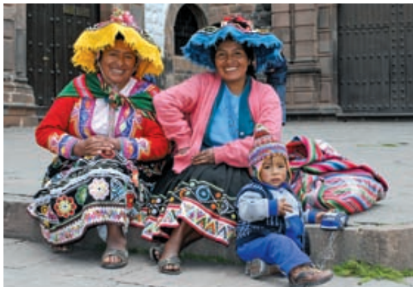
Cuzco w Peru – kobiety w strojach ludowych

tacje fotograficzne na trudnych oględzinach. Prowadzi również wykłady i szkolenia w WSPol. w Szczytnie i CSP w Legionowie dla sędziów, prokuratorów i policjantów na temat możliwości, jakie dają techniki fotograficzne w badaniach kryminalistycznych.