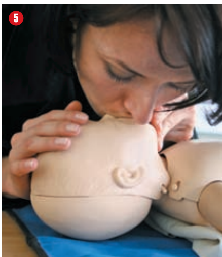
5 Resuscytację niemowląt i dzieci rozpoczynamy od podania pięciu oddechów ratowniczych