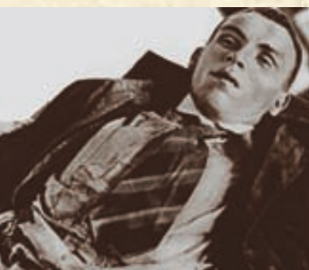
Nie chciał się poddać...