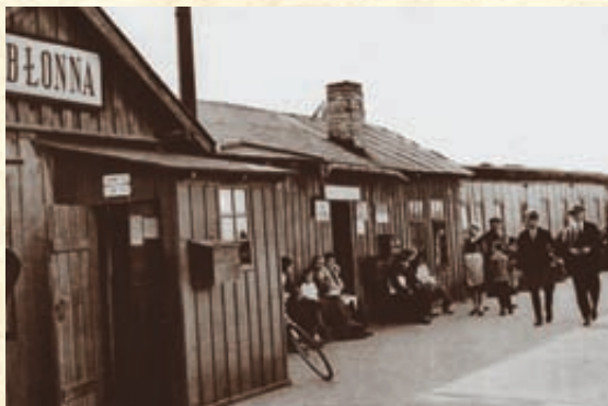
Stacja kolejowa w Jabłonie (rok 1932)