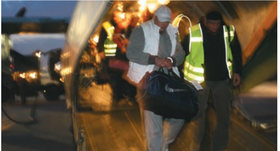
Przygotowywane jest nowe zarządzenie KGP w sprawie służby konwojowej

Oczywiście, do takiego sposobu zakucia muszą być spełnione określone przesłanki opisane w rozporządzeniu Rady Ministrów z 17 września 1990 roku w sprawie określenia przypadków oraz warunków i sposobów użycia przez policjantów środków przymusu bezpośredniego: osoba musi być niebezpieczna, zachowywać się agresywnie. W większości zdarzeń nadzwyczajnych, głównie ucieczek, podczas doprowadzeń takie przesłanki były, jednak policjanci zbagatelizowali zasady bez-