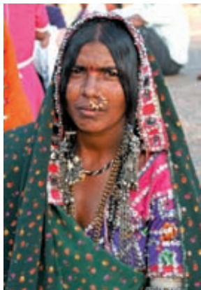
Bangalore w Indiach – kobieta z plemienia Gharwal