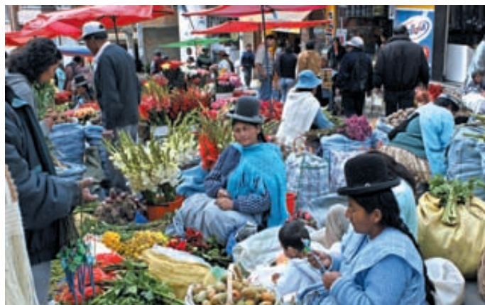
Bazar owocowy w La Paz w Boliwii