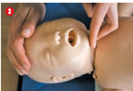
3 Głowa niemowlęcia znajduje się w pozycji neutralnej, nie należy odchyłać jej do tyłu. Opuszkami palców unieś mu brodę