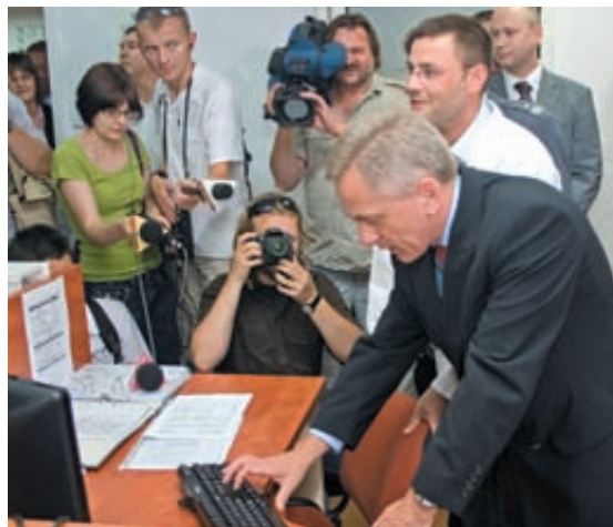
Kliknięcie wiceministra Rapackiego i... światowa baza DNA stanęła przed naszymi specjalistami otworem

TADEUSZ NOSZCZYŃSKI