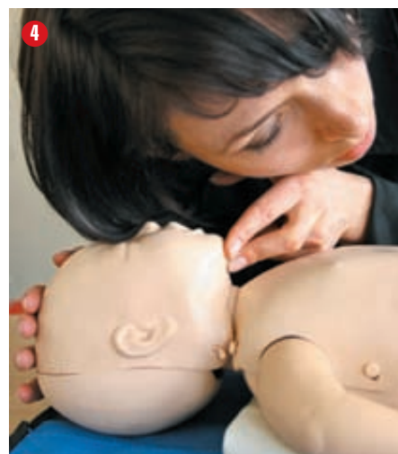
4 Sprawdź przez 10 sekund, czy u niemowlęcia występuje prawidłowy oddech: obserwuj ruchy klatki piersiowej, nastuchuj szmerów oddechowych i staraj się wyczuć ruch powietrza na swoim policzku