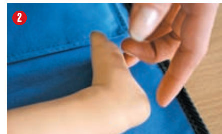
2 Sprawdź świadomość niemowlęcia i jego reakcję na głos i dotyk – możesz potaskać je w stópkę, mówiąc do niego