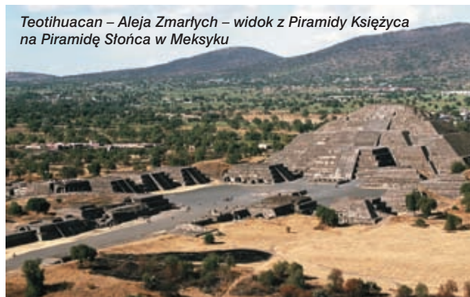
Teotihuacan – Aleja Zmarłych – widok z Piramidy Księżyca na Piramidę Słońca w Meksyku