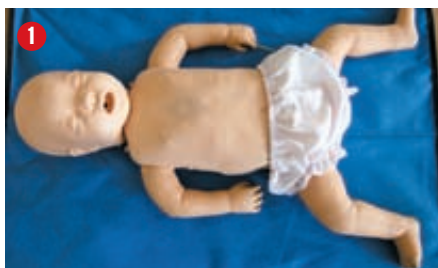
1 Sprawdź, czy niemowlę jest bezpieczne. Ułóż je na twardej podłodze