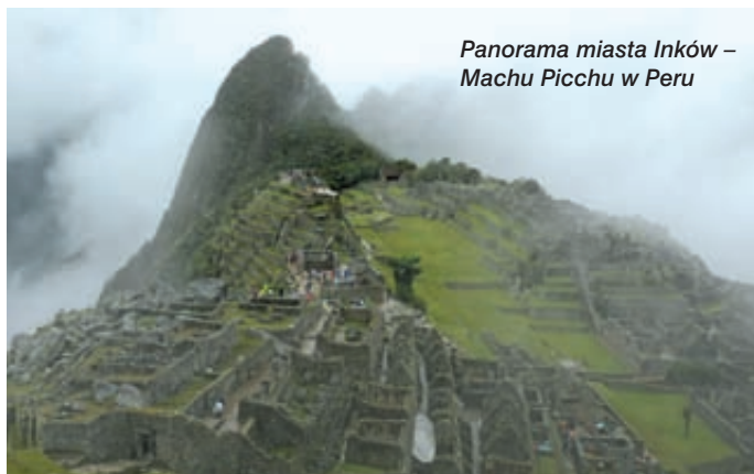
Panorama miasta Inków – Machu Picchu w Peru

PAWEŁ OSTASZEWSKI zdj. autor (1) i R. Sobolewski