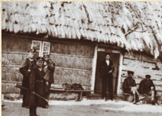
Chalupa Krogulów w Ostrowie, miejsce bestialskiego mordu