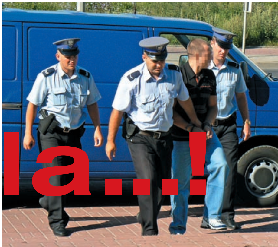
Większość ucieczek z konwoju zdarza się w czasie 48 godzin po zatrzymaniu

Zdarza się, że policjanci, którzy mają na przykład zawieźć zatrzymanego do prokuratury, brani są „z łapanki”. Nie zawsze mają wystarczające informacje o osobie,