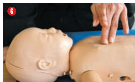
6 Opuszkami dwóch palców ułóż w jednej trzeciej dolnej części mostka i wykonaj 30 uciśnień. Po każdym ucisku relaksuj klatkę, nie odrywając palców, powtarzaj uciski z częstotliwością około 100 razy na minutę. Czas trwania ucisku i zwalniania nacisku (relaksacji) powinien być taki sam