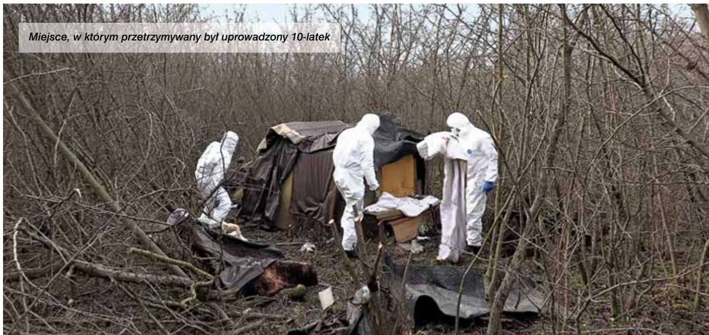
Miejsce, w którym przetrzymywany był uprowadzony 10-latek

Kiedy go uprowadził, wiedział, że Policja zostanie postawiona na nogi. Był do tego przygotowany, dlatego po pierwsze stworzył własny system bezpiecznych połączeń telefonicznych, po drugie, co rusz podrzucił Policji fałszywe ślady, w tym nawet ślady DNA przypadkowych osób.