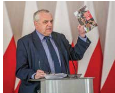
Adam Lipiński, sekretarz stanu, pełnomocnik rządu ds. społeczeństwa obywatelskiego i równego traktowania

na płeć oraz przemocy seksualnej w konfliktach zbrojnych, a także promocja i rozwój Agendy kobiet, pokoju i bezpieczeństwa w Polsce oraz w ramach współpracy międzynarodowej. Realizując powyższe cele Polska będzie dążyła do wzmocnienia pozycji kobiet w służbach mundurowych oraz zwiększeniu ich udziału w misjach i operacjach zagranicz-