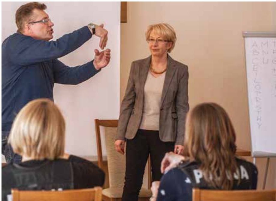
Szkolenia z języka migowego zorganizowane są dzięki współpracy z Polskim Związkiem Głuchych (Oddział w Białymstoku) i dofinansowywane ze środków PFRON-u.

P odczas kursu uczestnicy poznają podstawowe znaki i zwroty w języku migowym. Uczą się głównie funkcjonariusze z pionu prewencji i ruchu drogowego. Są dzielnicowi, którzy w swoich rejonach mają osoby z dysfunkcją narządu słuchu, dochodzeniowcy, którzy w swojej pracy mogą mieć do czynienia z osobami głuchymi lub głuchoniemymi. Są osoby przyjmujące zawiadomienia o popełnieniu przestępstwa i przyjmujące interesantów w jednostkach Policji. Uczestnictwo w szkoleniu jest dobrowolne. Warunek jest jeden: zgoda przełożonego, bo zajęcia odbywają się w godzinach służby i pracy.