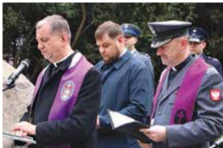
Modlitwa za zamordowanych w Zbrodni Katyńskiej

– Wierzymy w świętych obcowanie, ale tu na ziemi wieczność trwa tak długo, jak długo pamiętamy o poległych, jak długo pamiętamy o tych, którzy odeszli – podkreślił wice-minister Jarosław Zieliński. – Naszą podstawową powinnością jako ludzi i jako narodu jest pamięć o tych, którzy oddali swoje życie w służbie Ojczyźnie.