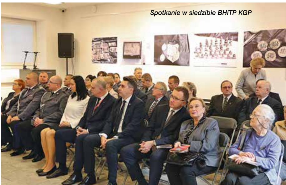
Spotkanie w siedzibie BHiTP KGP