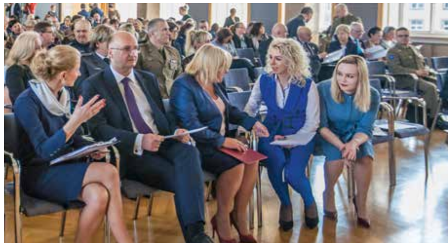
Konferencja odbyła się w Kancelarii Prezesa Rady Ministrów z inicjatywy pełnomocnika rządu ds. społeczeństwa obywatelskiego i równego traktowania