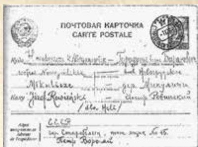
Karta pocztowa z obozu w Starobielsku