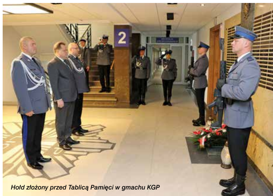
Hołd złożony przed Tablicą Pamięci w gmachu KGP