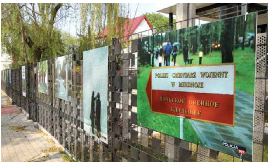
Wystawa Biura Komunikacji Społecznej KGP

gdzie spoczywa ponad 6 tys. polskich jeńców wojennych. Jeńców obozu specjalnego NKWD w Ostaszkwie, a kamień pokrywa urnę z ich prochami. Kamień mówi nam także o obowiązku pamięci.