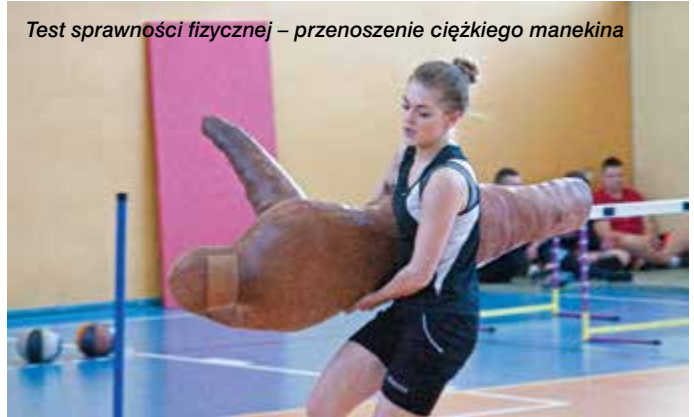
Test sprawności fizycznej – przenoszenie ciężkiego manekina