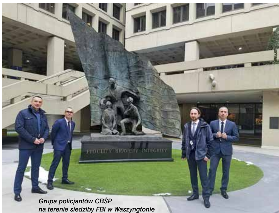
Grupa policjantów CBŚP na terenie siedziby FBI w Waszyngtonie

FBI bardzo ciekawym materiałem szkoleniowym. Porywacz 10-latek stosował wyszukane metody połączeń pośrednich, utrudniających namierzenie go. Budował specjalne urządzenia komunikacyjne, które wykorzystywał do kontaktów z pokrzywdzonymi. Zostawał je w różnych miejscach, uruchamiał zdalnie na 30 sekund, wysyłał sms i wyłączał. Dlatego urządzenia telefoniczne były niemożliwe do namierzenia.