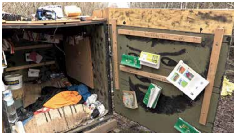
Wnętrze skrzyni, w której chłopiec przebywał 5 dni