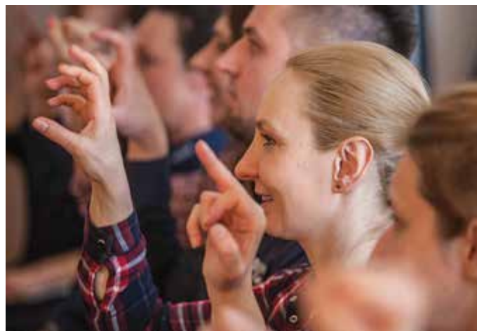
Podczas kursu policjanci i pracownicy Policji poznają ponad 300 znaków pojęciowych, które wystarczą do nawiązania podstawowego kontaktu z osobami niesłyszącymi