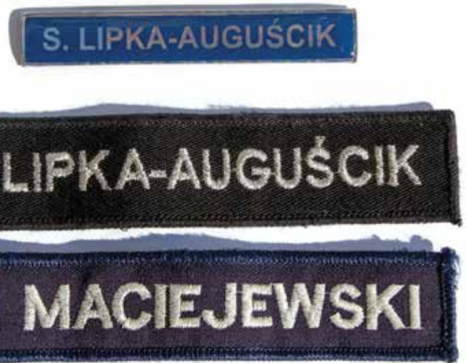
Pravidłowe znaki identyfikacji imiennej, przy czym czarny należy nosić do ubioru ćwiczebnego według dotychczasowego wzoru, tj. czarnego. Granatowe imienniki na „rzepa” obszyte są nicią tej samej barwy, a nie srebrną, którą wyhaftowane są litery