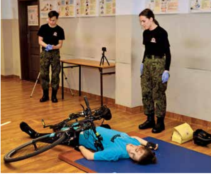
Konkurencja sprawdzająca umiejętności z udzielania pierwszej pomocy