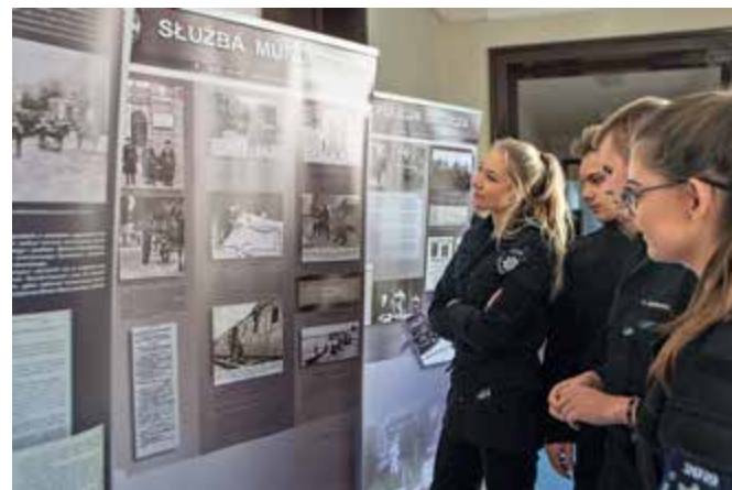
Uczniowie klas policyjnych oglądają wystawę historyczną o Policji Państwowej, przygotowaną przez BHIT KGP