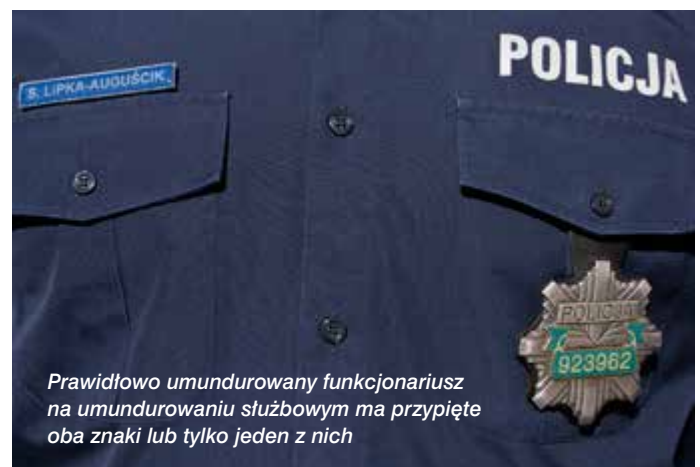
Pravidłowo umundurowany funkcjonariusz na umundurowaniu służbowym ma przypięte oba znaki lub tylko jeden z nich