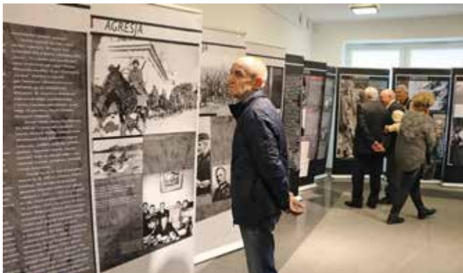
Ekspozycja historyczna, przybliżająca kulisy zbrodni katyńskiej, przygotowana przez BHiTP KGP i o. IPN w Łodzi

▶ Orkana, gdzie witała gości plenerowa wystawa pt. „Polskie cmentarze wojenne”, przygotowana w Biurze Komunikacji Społecznej KGP.