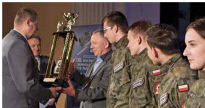
Zwycięska drużyna z LO ZDZ w Suwałkach