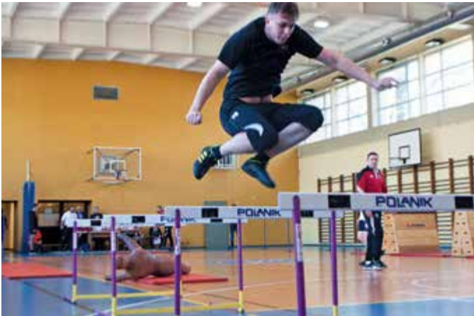
W teście sprawności fizycznej uczniowie walczyli o każdą sekundę