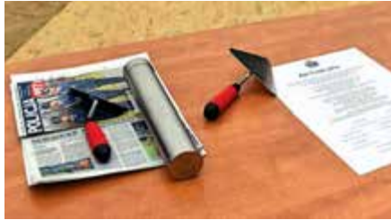
Do kapsuły włożono podpisany akt erekcyjny, „Policja 997” nr 169, „Dziennik Łódzki” z 12.04.2019 r.