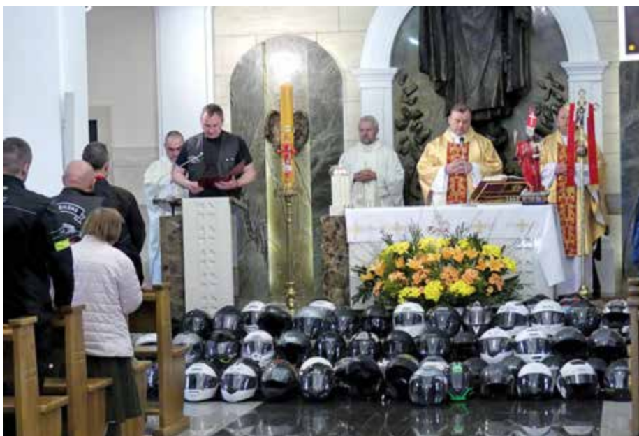
Msza Św. odbyła się w kościele Parafii Wojskowej pw. św. o. Rafała Kalinowskiego

KRZYSZTOF CHRZANOWSKI zdj. autor (2), Katarzyna Chrzanowska (1)