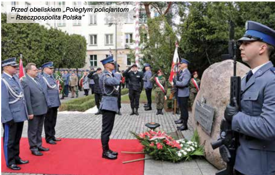
Przed obeliskiem „Poległym policjantom – Rzeczpospolita Polska”