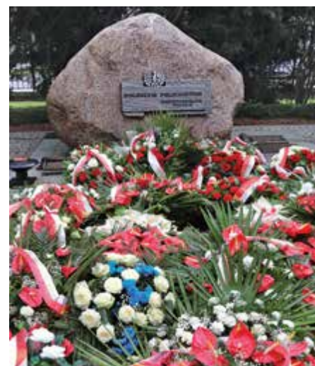
Kwiaty przed obeliskiem

Centralne policyjne uroczystości upamiętniające ofiary zbrodni katyńskiej odbyły się, podobnie jak rok temu, 11 kwietnia na dziedzińcu Komendy Głównej Policji. Pod Obeliskiem „Poległym Policjantom – Rzeczpospolita Polska” złożono wieńce, odmówiono modlitwę, a w przemówieniach przypomniano martyrologię przedwojennych stróżów prawa.