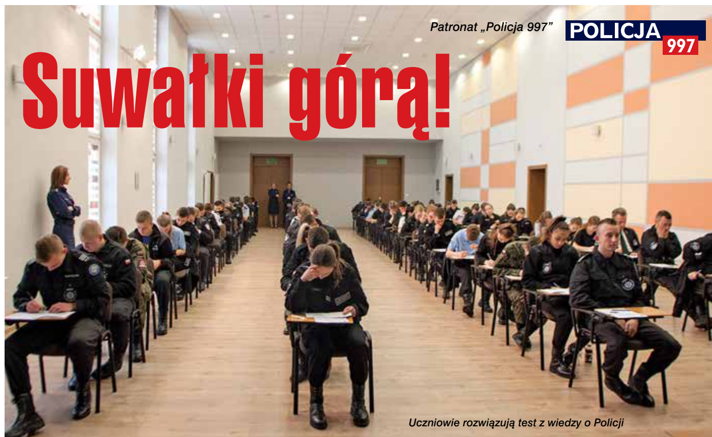
Uczniowie rozwiązują test z wiedzy o Policji

Tytuł „Klasy Policyjnej roku 2019” zdobyła reprezentacja Liceum Ogólnokształcącego Zakładu Doskonalenia Zawodowego w Suwałkach.