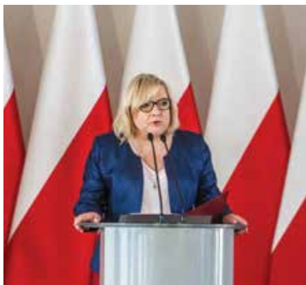
Minister Beata Kempa

stwo na świecie. Kobiety oraz dzieci są szczególnie narażone na przemoc, w tym przemoc seksualną, podczas konfliktów zbrojnych i kryzysów humanitarnych. Udział kobiet w misjach pokojowych jest wobec tego oczywisty.