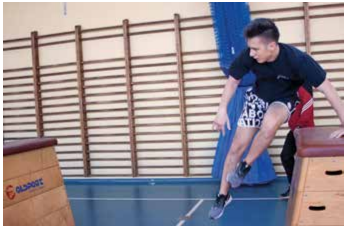
Skoki przez skrzynię podczas testu sprawności fizycznej

Uczestnicy i słuchacze Szkoły Policji w Pile mogli obejrzyć wystawę historyczną o Policji II RP przygotowaną przez Biuro Historii i Tradycji Policji KGP. Wielu uczniów klas policyjnych po egzaminie maturalnym chce związać swoją przyszłość z formacjami mundurowymi, w tym większość z Policją.