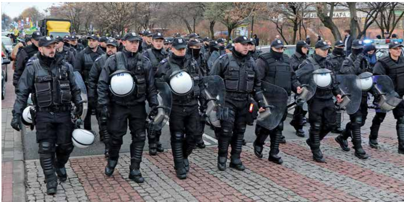
Identyfikatorów imiennych nie nosi się na elementach umundurowania podczas służby w pododdziale zwartym

ANDRZEJ CHYLIŃSKI