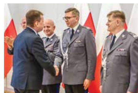
Podziękowania za służbę od byłego szefa resortu SWiA Mariusza Błaszczaka