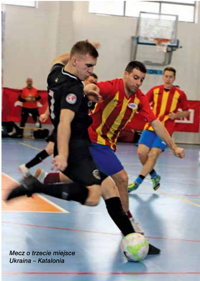
Mecz o trzecie miejsce Ukraina – Katalonia