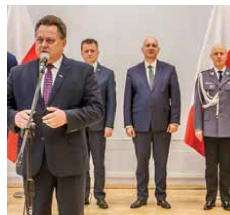
...i wiceminister SWiA Jarosław Zieliński