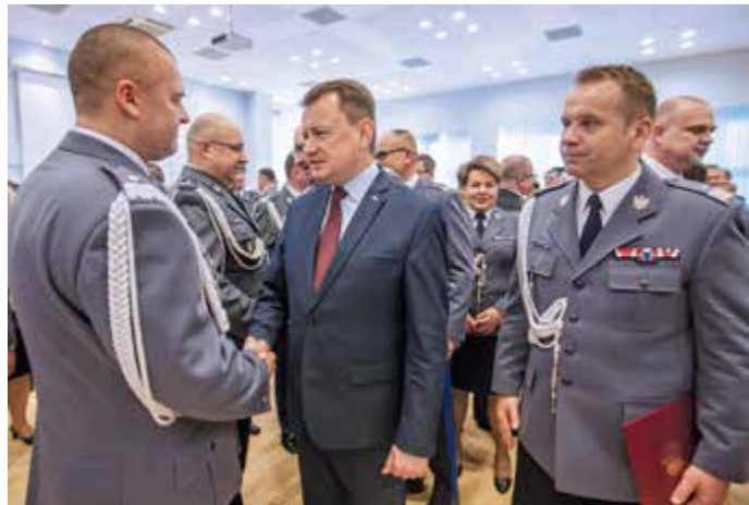
Gratulacje mianowanym składali zarówno obecni, jak i byli szefowie resortu