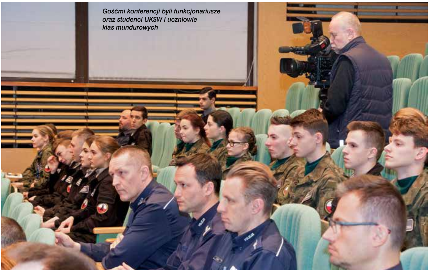
Gośćmi konferencji byli funkcjonariusze oraz studenci UKSW i uczniowie klas mundurowych

Pomysł ten znalazł także zastosowanie po tragicznym trzęsieniu ziemi na Hiati w 2010 r. Docierały SMS-y od ludzi spod gruzów, a dzięki włączonej lokalizacji można było ich namierzyć. Także z wykorzystaniem tej aplikacji zbierano informacje: co jest potrzebne i gdzie? Woda, żywność, namioty.