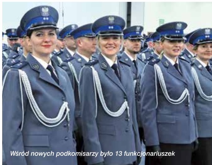
Wśród nowych podkomisarzy było 13 funkcjonariuszek

Po mianowaniu ekumenicznego błogosławieństwa na dalszą służbę dla nowych oficerów Policji udzielili przedstawiciele duchowieństwa. Następnie głos zabrał premier Mateusz Morawiecki, który podkreślił, że to Policja jest gwarantem bezpiecznego życia i aby Polacy czuli się coraz bezpieczniej, musi być sprawna i nowoczesna, a służy temu m.in. realizowany obecnie program modernizacji służb mundurowych.