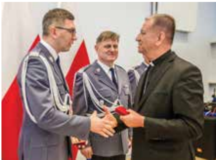
Biskup polowy WP gen. bryg. Józef Guzdek wręcza ustępującym generalom pamiątkowy medal

prowadzono profesjonalnie, zarówno podczas ŚDM, jak i kolejnych dużych zabezpieczeń, szczególnie dziękuję temu, kto bezpośrednio nadzorował te operacje – nadinsp. Janowi Lachowi.