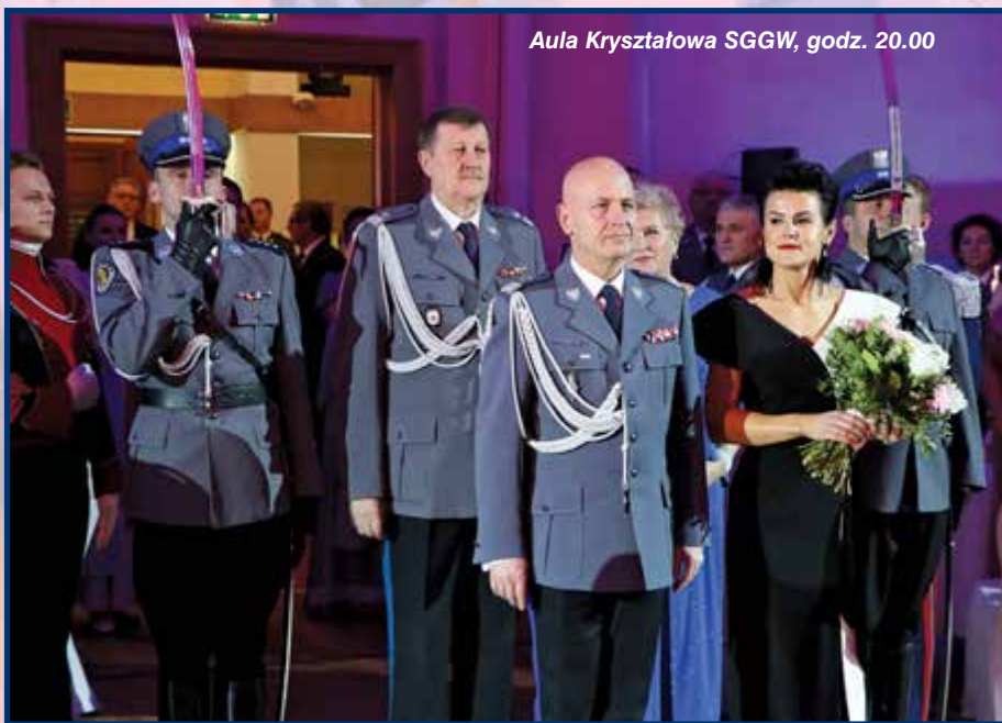
Aula Kryształowa SGGW, godz. 20.00