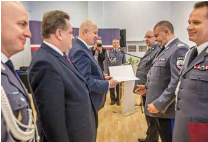
Akty mianowania na stanowiska wręczył nowym zastępcom komendanta głównego minister Joachim Brudziński