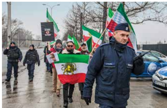
Policja zabezpieczała 12 zgromadzeń publicznych, ale podczas żadnego z nich nie musiała interweniować

Przyjęcie gości przybyłych z wielu stron świata poprzedziło dokładne sprawdzenie pirotechniczne Zamku Królewskiego, Parku Łazien-