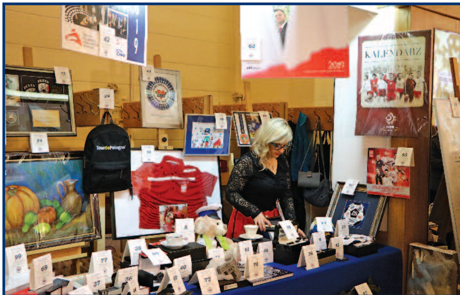
W foyer auli wystawione były liczne przedmioty, które można było nabyć, aby wspomóc Fundację