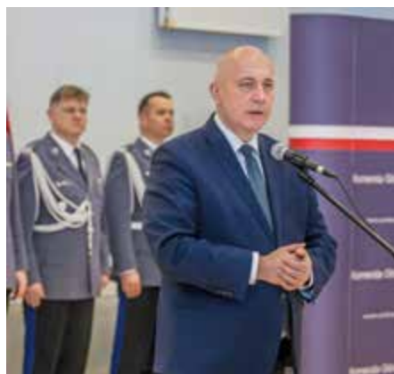
Minister SWiA Joachim Brudziński