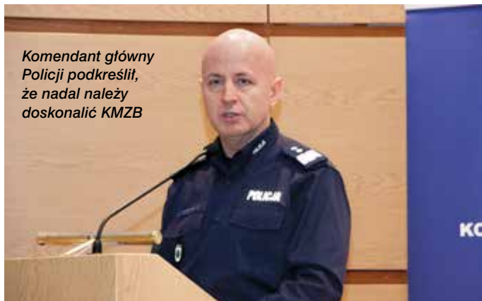
Komendant główny Policji podkreślił, że nadal należy doskonalić KMZB

Geodezji i Kartografii m.in. do działań na rzecz bezpieczeństwa publicznego.