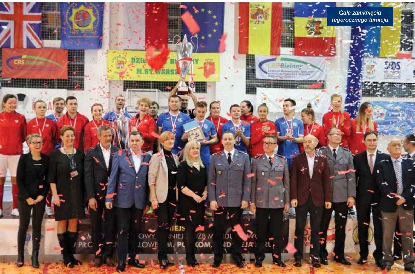
Gala zamknięcia tegorocznego turnieju