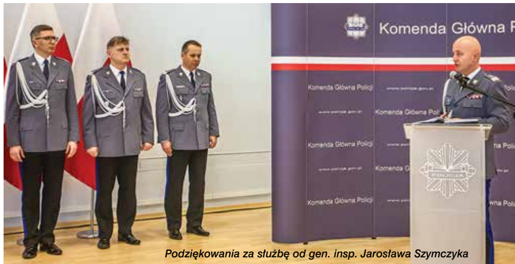
Podziękowania za służbę od gen. insp. Jarosława Szymczyka

Zgodnie z ceremoniałem pożegnanie rozpoczęło się od złożenia meldunku ministrowi SWiA i wniesienia sztandaru Komendy Głównej