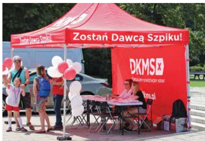
Na pikniku przybyło 23 kandydatów na dawców szpiku