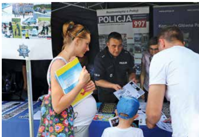
Na stoisku BKS KGP były ostatnie wydania miesięcznika „Policja 997”, a także to, co interesowało najmłodszych: komiksy, kolorowanki i samochody do sklepania