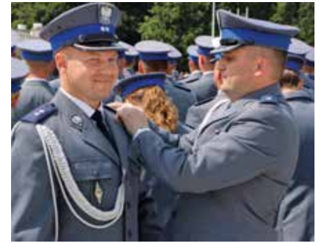
Można już przekroczyć pagony!

Morawieckiego, aby zadeklarować, że jeżeli tylko pozwolą na to możliwości finansowe budżetu państwa, to nie poprzestaniemy na tym programie. Będziemy szukać dalej środków. Jako politycy musimy być skrzętni