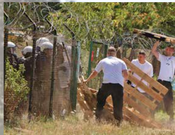
W role naruszających zbiorowo porządek (białe koszulki) wcielili się policjanci

W operacji „Garda 2018” wzięło udział ponad 1100 funkcjonariuszy z OPP i SPPP ze wszystkich garnizonów. Dojeżdżali na miejsce ćwiczeń, czyli na drawski poligon, w czasie rzeczywistym ze swoich jednostek, kwatrowali się w namiotach i włączali do akcji. Tu od 2 do 6 lipca br. sprawdzono w praktyce działanie dużych związków taktycznych Policji, a w szczególności poziom wiedzy ćwiczących dotyczący zaktualizowanej taktyki działania pododdziałów zwartych w sytuacji zagrożenia bezpieczeństwa lub zbiorowego naruszenia porządku publicz-