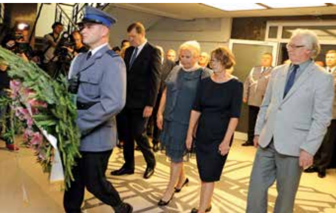
Wieniec składają przedstawiciele Fundacji Pomocy Wdowom i Sierotom po Poległych Policjantach