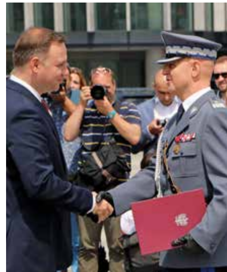
Nominację na stopień generalnego inspektora z rąk prezydenta Andrzeja Dudy odbiera komendant główny Jarosław Szymczyk

Patronat Honorowy Prezydenta Rzeczypospolitej Polskiej Andrzeja Dudy w roku 100-lecia Odzyskania Niepodległości 1918–2018