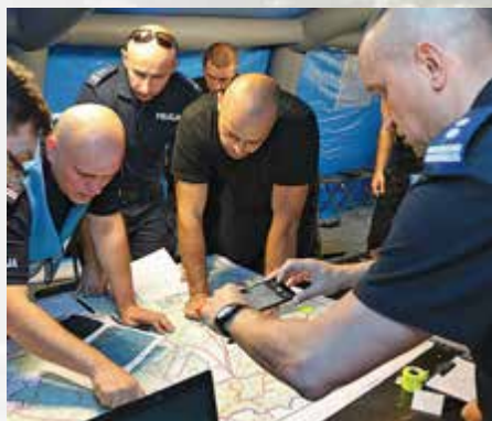
Narada w namiocie sztabowym