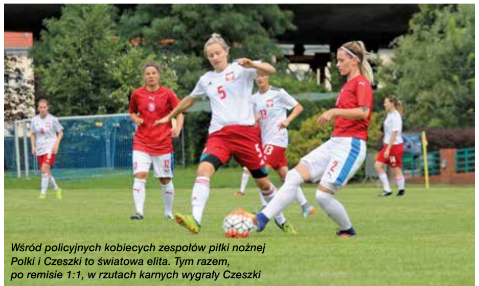
Wśród policyjnych kobiecych zespołów piłki nożnej Polki i Czeszki to światowa elita. Tym razem, po remisie 1:1, w rzutach karnych wygrały Czeszki

Bieg charytatywny Policji na rzecz Fundacji Pomocy Wdowom i Sierotom po Poległych Policjantach – był krótszy, ale emocje i chęć zwycięstwa większe. Nic dziwnego, bo startowały dzieci, a kilkadziesiąt metrów po tar-