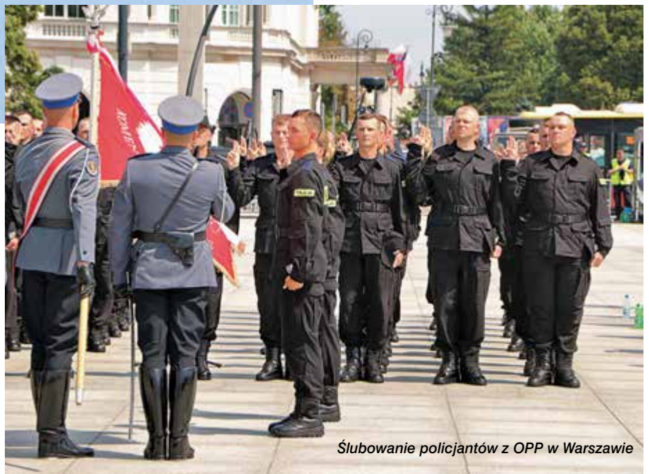
Ślubowanie policjantów z OPP w Warszawie

– Jestem ogromnie dumny, że w 2016 roku mogłem zapowiedzieć Program modernizacji służb mundurowych – powiedział prezydent. – I to, że polska Policja otrzyma wsparcie – zarówno bezpośrednio to finansowe w postaci wzrostu uposażeń, jak i wsparcie w nowe wyposażenie, nową infrastrukturę, nowy sprzęt. Mam nadzieję, że będzie to z pożytkiem dla nas wszystkich – tego z całego serca państwu i sobie życzę. Szczęście Boże polskiej Policji, jej funkcjonariuszom i pracownikom!