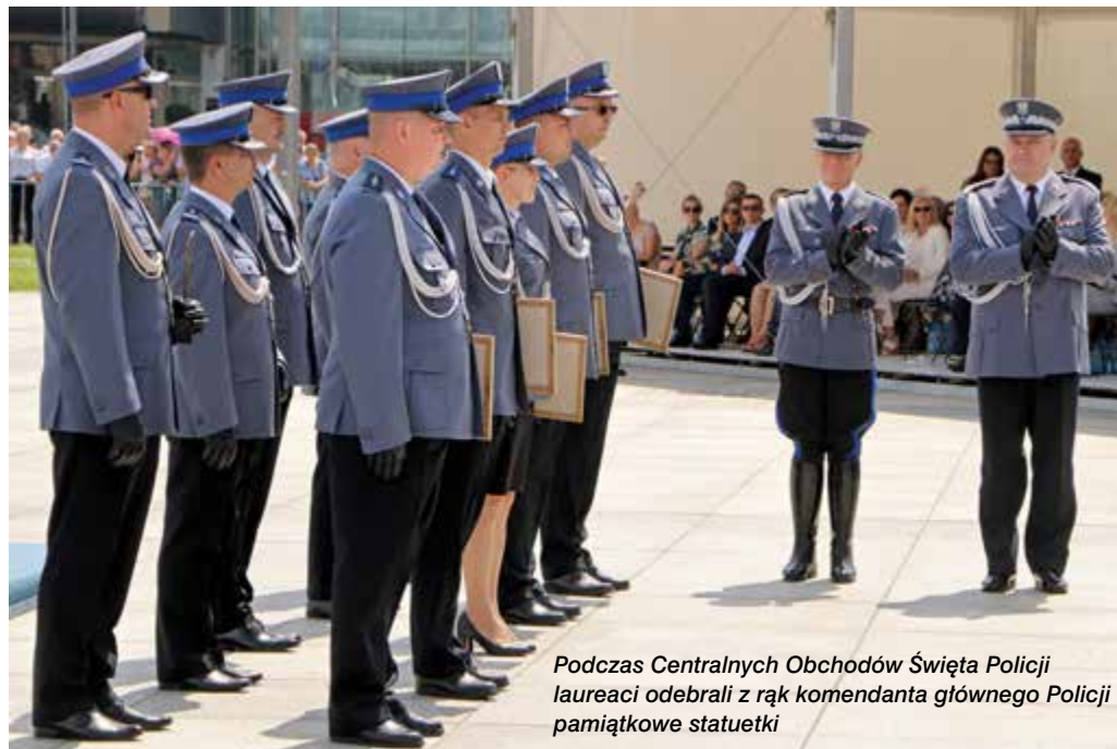
Podczas Centralnych Obchodów Święta Policji laureaci odebrali z rąk komendanta głównego Policji pamiątkowe statuetki