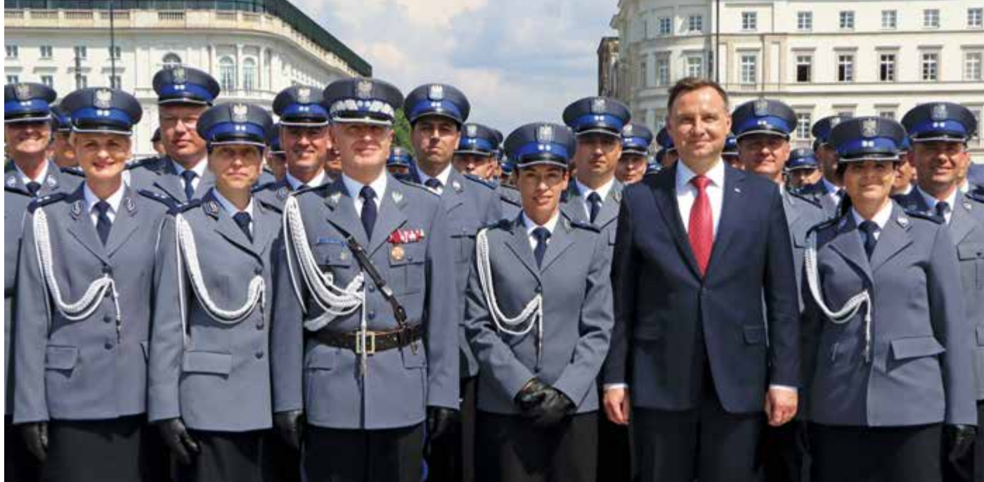
Prezydent RP Andrzej Duda i komendant główny Policji gen. insp. Jarosław Szymczyk w otoczeniu świeżo promowanych oficerów