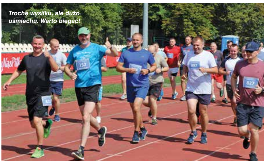
Trochę wysiłku, ale dużo uśmiechu. Warto biegać!

oraz Stołecznej Grupy Wojewódzkiej MSP IPA. W tym roku piknik był bardzo udany, można się więc spodziewać, że w przyszłym, podczas obchodów setnej rocznicy powstania