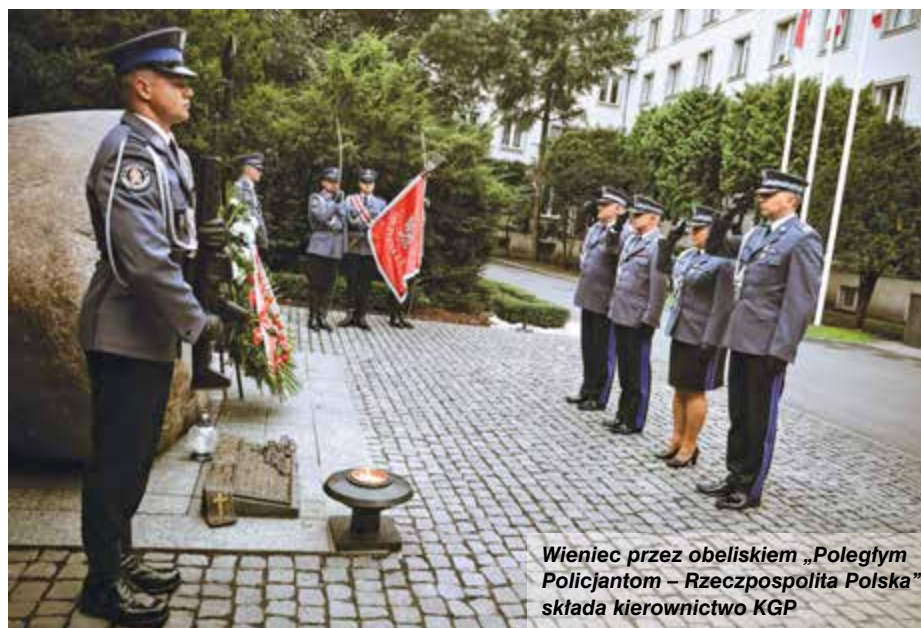
Wieniec przez obeliskiem „Poległym Policjantom – Rzeczpospolita Polska” składa kierownictwo KGP

uroczystości centralne. Przed Grobem Nieznanego Żołnierza wystawiono policyjny posterunek honorowy. Hymn Rzeczypospolitej Polskiej i podniesienie flagi państwowej na maszt rozpoczęły ceremonię. Na trybunie honorowej obok kierownictwa Policji znaleźli się znamienici goście. Obecni byli m.in.: prezydent RP Andrzej Duda, minister spraw wewnętrznych i administracji Joachim Brudziński, dyrektor wykonawczy Europolu Cathrine de Bolle, szefowie zaprzyjaźnionych służb oraz liczne delegacje zagranicznych policji, z takich krajów, jak: