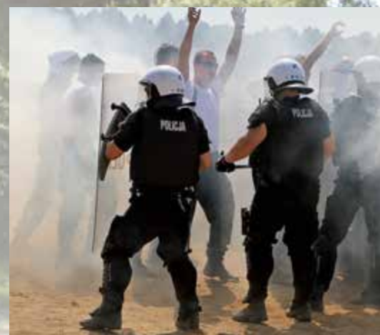
Po „wybuchu” bomby „demonstranci” wszczęli rozruchy, co utrudniało dotarcie do rannych

nego. Ćwicząco także działania pościgowe, poszukiwanie zaginionych, udzielanie pierwszej pomocy w warunkach zagrożenia i ewa-