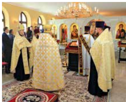
Nabożeństwo w cerkwi św. Jerzego Zwycięzcy