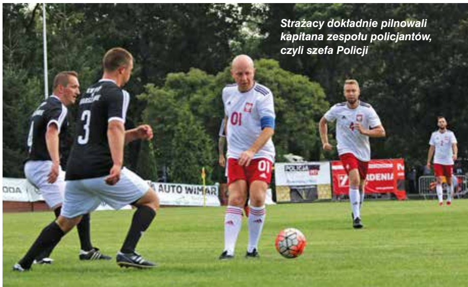
Strażacy dokładnie pilnowali kapitana zespołu policjantów, czyli szefa Policji

Organizatorem pikniku rodzinnego na Agrykoli był Gabinet KGP przy współpracy Regionu Centralne Biuro Śledcze MSP IPA