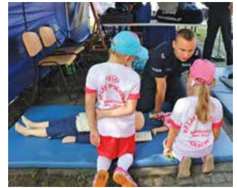
Dzieci uczyły się udzielać pierwszej pomocy dzieciom