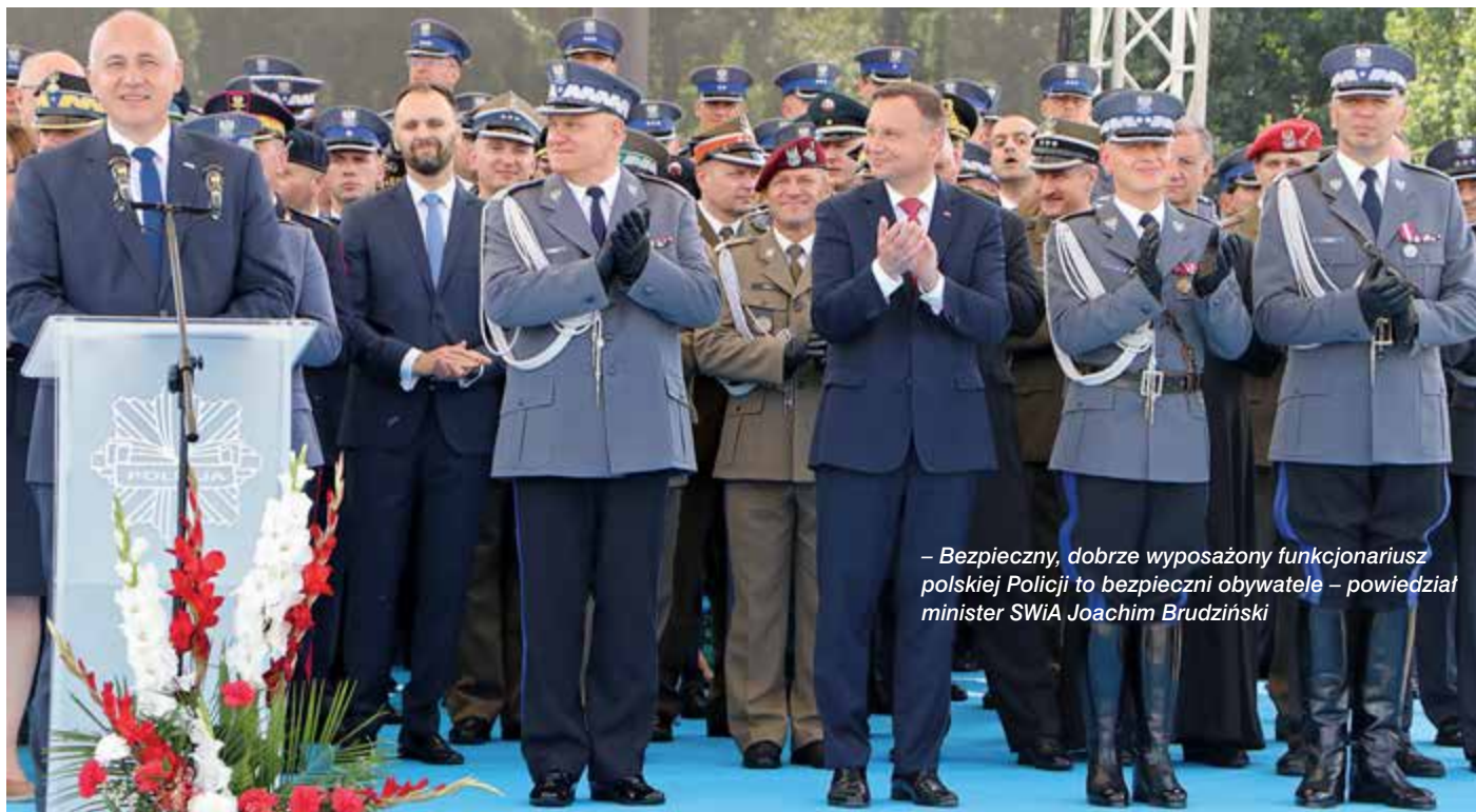
– Bezpieczny, dobrze wyposażony funkcjonariusz polskiej Policji to bezpieczni obywatele – powiedział minister SWiA Joachim Brudziński