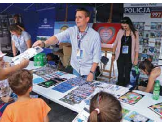
Stoisko Biura Komunikacji Społecznej KGP