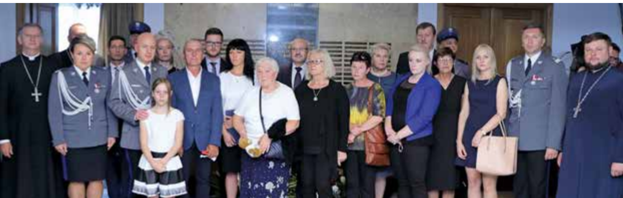
Rodziny niezujących funkcjonariuszy z kierownictwem Policji i zaproszonymi gośćmi, w tle Tablica Pamięci